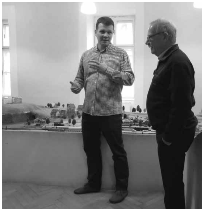
Otvorenie ZaHRAJdy