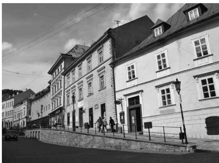
Korzo na Trotuári

„Rozpočet Mesta Banská Štiavnica bol schválený vyrovnaný s miernym prebytkom. Príjmy aj výdavky tvoria 8,8 mil. EUR. Rok 2019 bude mimoriadny tým, že Banská Štiavnica bude prvým slovenským mestom kultúry, z čoho vyplývajú aj zvýšené výdavky na kultúrne akcie, ktoré budú z prevažnej časti hrazené dotáciou z Fondu na podporu umenia.