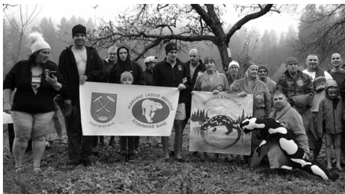
Otužilci zo Štiavnice a Piargu