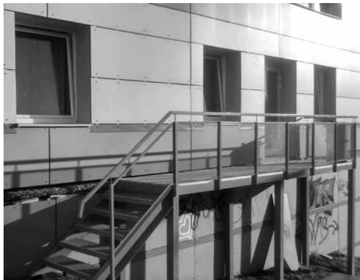
Nocľaháreň pre bezdomovcov