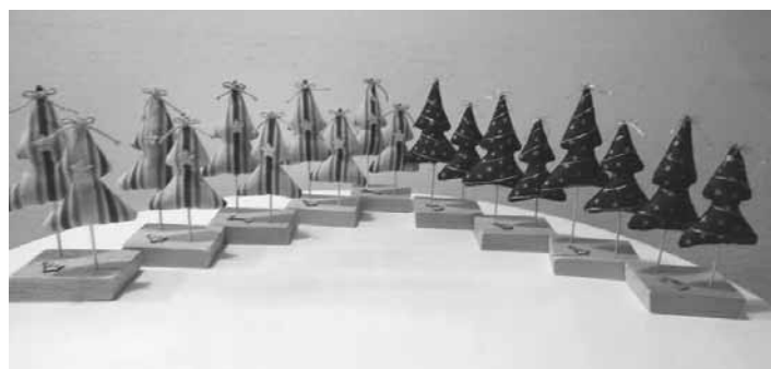
Vianočné ozdoby

lienkami a nespočetnými nápadmi tvoriť niečo nové a túžbou zanechať po sebe niečo pekné a užitočné vznikol projekt, ktorý sa uskutočnil vďaka finančnej podpore Nadácie SPP.