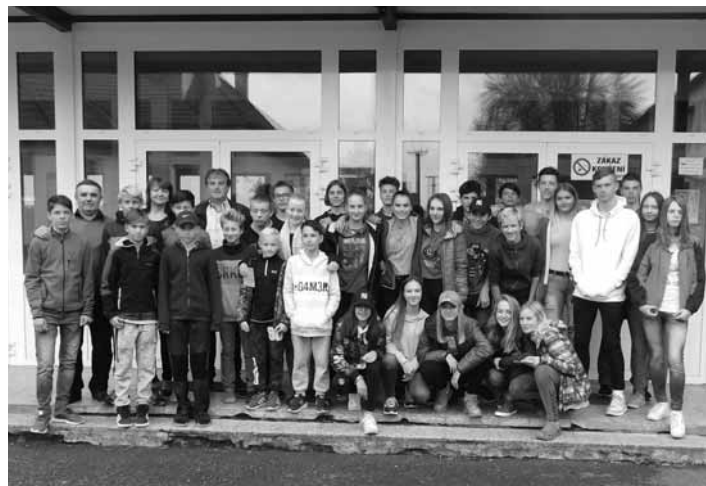
Žiaci ZŠ J. Horáka

Okrem športu sa žiaci na návšteve v Moravskej Třebovej zúčastnili prehliadky mesta, rôznych výletov v okolí. Tiež boli prítomní na sláv-