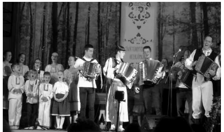
Prehliadka heligónkárov zo Slovenska