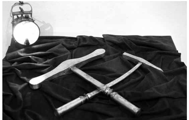
Strieborné kladivko a železko

Pozoruhodný je dizajnový koncept tvarov predmetov a náročne realizované dekorácie jemným rytím (gravírovaním). Kladivko a železko je vyrobené zo striebra, s pozlátenými časťami. Predovšetkým kladivko je špecificky tvarované, s elegantne zvlhnutými okrajmi. Čelné plochy kladivka sú dekorované obrazovými námetmi rytím s tradičnou symbolikou (erb mesta, banické námety, odkazy na antiku), ktorú dopĺňajú texty v nemčine. Kladivko (na oboch stranách) dekoru-