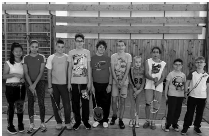
Žiaci na bedmintonovom turnaji