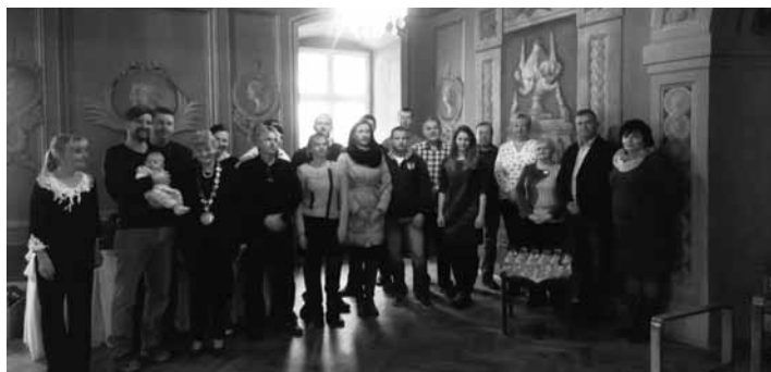
Darcovia krvi na radnici