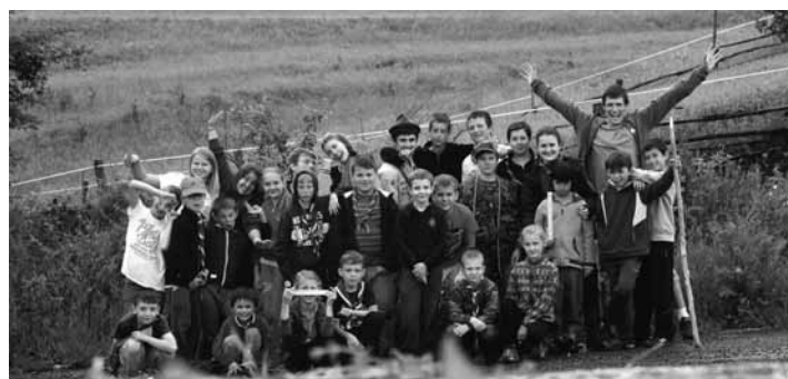
Mladí skauti na potulkách po Slovensku

Všetky tieto oblasti rozvoja u deti rozvíjame nielen každý týždeň na