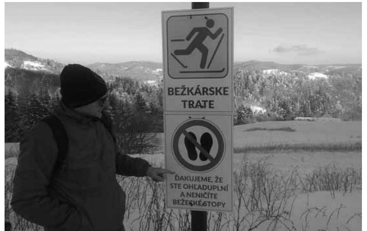
Informačná tabuľa na bežkárskych tratiach

Prvý sneh nás prekvapil už na prelome novembra a decembra. V sedle Červená studňa ho napadlo takmer 50 cm, čo sú ideálne podmienky na prevádzku bežkárskych tratí. Prvá úprava sa vykonávala už 30.11. a boli pripravené trate v rozsahu cca 30 km. Okrem už klasických trás po Horňáckom jarku od Červenej studne po Sedlo Pleso, sú pripravené aj úseky cez Zadné Rosniarky po Veterné sedlo a ponad Ottergrund na Hornú Roveň. Z Hornej Rovne sa dá pokračovať cez Farárovu hôrku až na Sedlo Pleso. Pre tých, ktorí nestihnú prevetrať bežky v lone prírody je tu ešte možnosť zabehať si na ovále futbalového štadióna, kde je do 19:00 zabezpečené aj osvetlenie. Teraz nám zostáva už len dúfať, že snehová pokrývka vydrží čo naj-