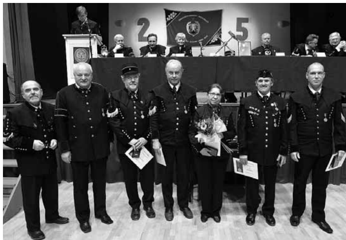
Odovzdanie ďakovných listov

Spolok bol založený 19.11.1992 a vznikol transformáciou Základnej organizácie Slovenskej vedecko-technickej spoločnosti pri závoде Rudných baní v Banskej Štiavnici. Podujatie začalo slávnostným nástupom čestného predsedníctva, do ktorého prijali pozvanie nasledovné osobnosti: