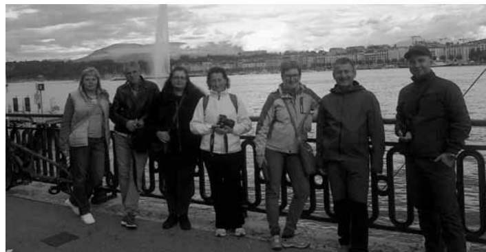
Pracovníci múzea v Ženeve