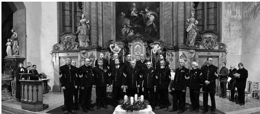
Vystúpenie spevokolu Štiavničian v Kostole sv. Kataríny