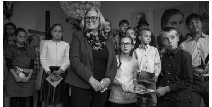
"Krst" knihy Vtáky Slovenska a Nórska