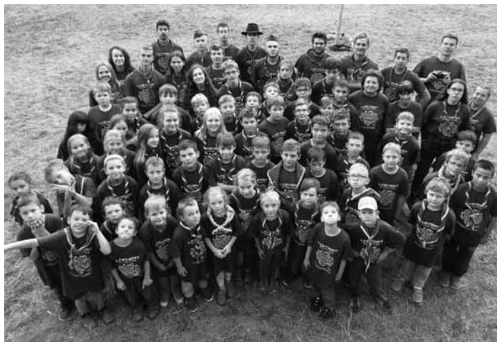
Skautský banskosťiavnický zbor

Ako skauti sa podieľame na mnohých verejných akciách, ktorými sú akcie katolíckej farnosti, mesta Banská Štiavnica, roznášanie Betlehemskeho svetla, alebo sme sa ako dobrovoľníci podieľali na rekonštrukcii Kalvárie. Okrem akcií pre verejnosť tvoríme aj vlastné akcie ako skautské plesy, výlety do hôr a samozrejme letné skautské tábory, kedy táboríme na lúke, varíme si v poľnej