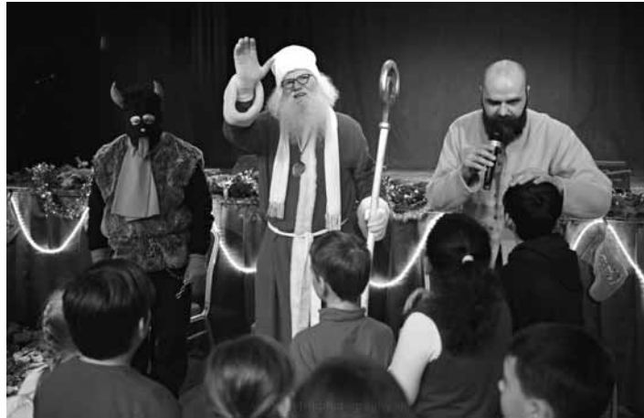
Mikuláš s čertíkom a deťmi v kultúrnom centre

O jeho živote sa zachovalo viac legiend ako faktov. Podľa tradície sa narodil v polovici 3. storočia v meste Patara v dnešnom Turecku, ako jediný syn bohatých a zbožných rodičov. Znáмым sa stal najmä pre svoju štedrosť a súcit s chudobnými. Svätý Mikuláš sa stal patrónom námorníkov a rybárov, ale aj vŕôd a mostov, obchodníkov, lekárníkov, voňavkárov a šťastného manželstva. Pomáha rodičkám a ochraňuje žiakov a deti v chorobách. Už v stredoveku si ľudia svätého Mikuláša pripomínali obdarúvaním svojich blízkych. V súčasnosti sa vždy tešíme na začiatok decembra, kedy si práve sviatkom sv. Mikuláša pripomíname dobrosrdečné činy jednej z najznámejších postáv v dejinách ľudstva. Pociť, idea, ktoré sa ťahajú stáročiami, v nás vždy spustia chuť darovať a byť obdarovaný.