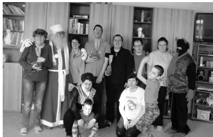
Klienti sociálneho strediska s Mikulášom