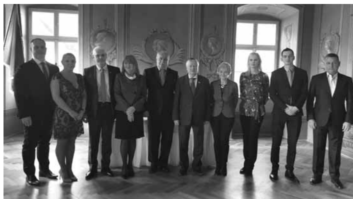
Delegácia v obradnej miestnosti

Všetkých prítomných vzácných hostí privítala primátorka nášho mesta, ktorá vo svojom príhovore vyzdvihla skutočnosť, že je jej veľkou