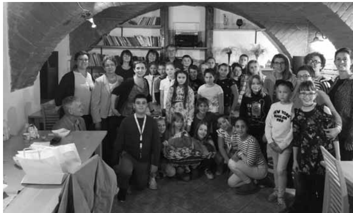
Žiaci z výnimočného projektu

Hlavným cieľom projektu je rozvíjať v žiakoch úctu k histórii, ktorá ovplyvnila to, kde sa nachádzame v prítomnosti a nemalej miere aj to, kam smerujeme do budúcnosti. Je dôležité pestovať v žiakoch úctu k vlasti, kraju, ľudovému umeniu a viesť ich k uchovávaniu kultúrneho a historického dedičstva našich predkov. Tak môžeme vychovať sebedomých občanov, ktorí sú schopní porozumieť iné kultúry a byť tolerantní k iným národom. V prípade nášho projektu je to, čo nás všetkých spája jedlo, prostredníctvom objavovania tradičných jedál, ich príbehov a historických súvislostí, ktoré ovplyvňovali produkciu lokálnych surovín, chceme objavovať naše regióny a ich histó-