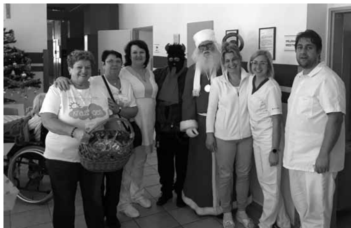
Dobrovoľníci z centra Krajsí deň v nemocnici

Prečo rekordman? Už 50 rokov, každý rok, navštevuje chorých a deti v Banskej Štiavnici a je zapísaný v slovenskej knihe rekordov. Apropos, tá brada bola pravá. Mikuláš rozdával sladké medovníčky spolu s dobrovoľníkmi dobrovoľníckeho centra Krajsí deň, nielen pacientom hospitalizovaným na Oddelení dlhodobých chorých a v Dome ošetrovateľskej starostlivosti, ale aj našim zamestnancami a návštevníkmi