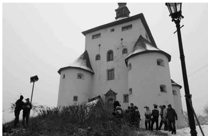
Odstraňovanie náletových drevín