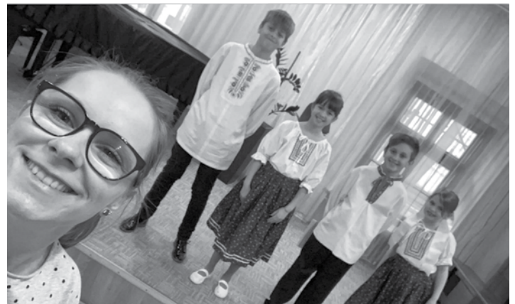
Ocenení v speve ľudových piesní