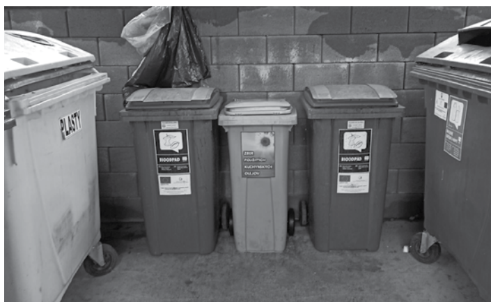
Nová nádoba na zber jedlých olejov