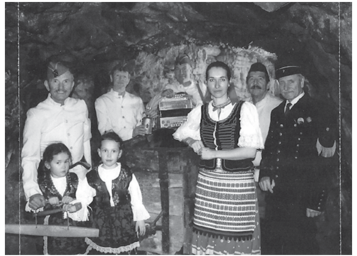
FS Sitňan