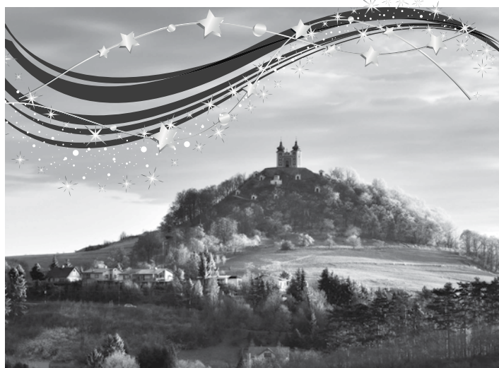
Pohľad na dominantu mesta - Kalváriu

Rok 2021 sa chýli ku koncu a my zatvárame knihu, ktorej kapitoly pre nás napísal život, náročné obdobie spojené s celosvetovou pandémiou COVID-19. Zmenil sa náš život, to čo sme považovali za samozrejmé, zrazu sa stalo pre nás cenným, bojíme sa o svojich blízkych, želáme si hlavne, aby sme toto náročné obdobie zvládli v zdraví. A aj tu je čas, aby sme hlboko v sebe považovali o skutočných ľudských hodnotách, o ľudskosti, láske, spolupatričnosti a šírili okolo seba lásku a dobro, ktoré je v každom z nás.