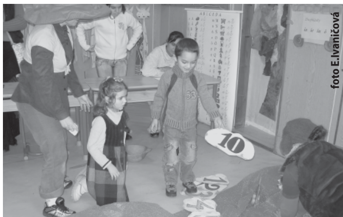
Deti sa tešia od septembra do školy.

Dieťaťu, ktorého rodičia zapíšu do školy, sa od 1. septembra skončia bezstarostné chvíle škôlkara. Začnú dni a týždne naplnené poznávaním, učením, písaním, čítaním, začne sa pre neho ďalšia kapitola na ceste za vzdelaním. Ako hovoril Ján Amos Komenský, na dobrom začiatku naozaj veľmi záleží... pretože neraz prvé neúspechy dieťaťa v škole natrvalo poznačia jeho ďalší vývin nielen v oblasti vzdelávania, ale i v živote vôbec. Centrum pedagogicko-psychologického poradenstva a prevencie (predtým Pedagogicko-psychologická poradňa) v Banskej Štiavnici pôsobí už viac ako 10 rokov. Naším poslaním je okrem iného aj pomoc rodičom, ktorí sa nevedia rozhodnúť, či dať dieťa do školy hneď po dovŕšení šiesteho roku, alebo využiť možnosť ročného odkladu povinnej školskej dochádzky. Keď hovoríme o psychologickom vyšetrení, máme na mysli školskú spôsobilosť alebo zrelosť, resp. pripravenosti dieťaťa na školu. Znamená to dosiahnutie takého stupňa vo vývine dieťaťa, aby si mohlo bez väčších problémov úspešne osvojiť školské vedomosti a zručnosti. Tento pojem zahŕňa telesnú, psychickú aj sociálnu zrelosť. Telesnú zrelosť nechávame na posúdenie pediatrovi, ktorý dieťa dobre pozná a dokáže zhodnotiť jeho telesné a zdravotné