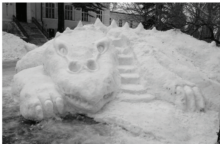
Výsledok tvorivosti študentov

„Tohtoročná snehová nádielka nás príjemne prekvapila. Z tohto dôvodu sme sa rozhodli, že sa pokúsime vytvoriť so žiakmi 2., 3. a 4. ročníkov odboru Propagačného výtvarníctva niečo nové a kreatívne ako tomu bolo aj minulý rok. Snehu napadlo tohto roku veľa, je to materiál zadarmo a ľahko spracovateľný, preto nebol problém vytvoriť z neho niečo zaujímavé. Študenti takto si mohli vyskúšať aké je to vymodelovať alebo vytvo-