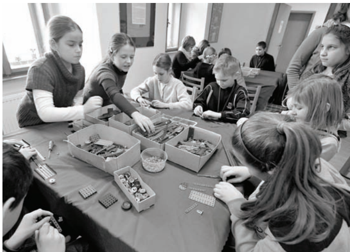
Výstava zaujala hlavne mladšiu generáciu

■ Prijmeme do PP kuchára a čašníka s praxou od 1.2.2013, tel.č.: 0918 442 254, e-mail: zsunikoletta@gmail.com