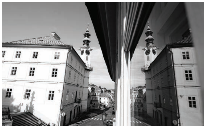
Budova banskoštiavnickej radnice

„Príprava rozpočtu Mesta Banská Štiavnica pre ďalšie rozpočtové obdobie (2013 – 2015) bola veľmi náročná. Mesto Banská Štiavnica sa pripojilo k Memorandu o spolupráci pri uplatňovaní rozpočtovej politiky orientovanej na zabezpečenie finančnej stability verej-