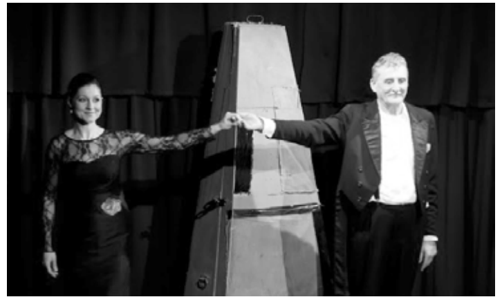
Derniéra Martina Hubu v Divadle pivovaru Erb

Vyššie hodiny nezišiel zo scény a predviedol zaplnenej sále bohatú škálu svojho hereckého umenia. Výraznými gestami, skvelou mimikou, striedaním hlasovej intenzity, rytmu a úzkym kontaktom s publikom si od prvej chvíle podmanil hľadisko. Spočiatku chrľil chválospevy na kontrabas, čiže basu. Hoci sa hudobník s týmto nástrojom nachádza vždy v poslednom rade orchestra, kontrabas je ústredným orchestrálnym nástrojom a žije si svojím samostatným životom. „Orchester môže byť bez dirigenta, ale nie bez kontrabasu,“ – usiluje sa presvedčiť všetkých. Nasledovala krátka história tohto hudobného nástroja i smutné konštatovanie, že skladatelia písali party pre kontrabas „lárom – fárom“, dokonca aj také, ktoré sa zahrať nedajú. Hra na tomto nástroji je fyzicky náročná, počas vystúpenia hudobník stratí aj 2 – 3 kilá, čo je z jednej strany výhodné – nemu-