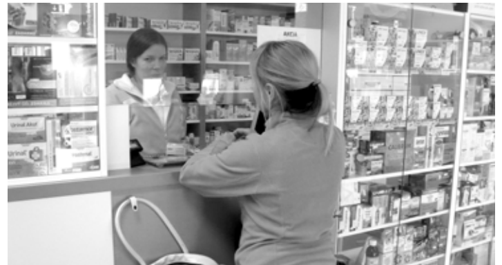
Lekárňa Mima na sídlisku Drieňová

V lekárni MIMA na vás čaká milý, ústretový a ochotný personál. Pacientov nelákame na „ex-