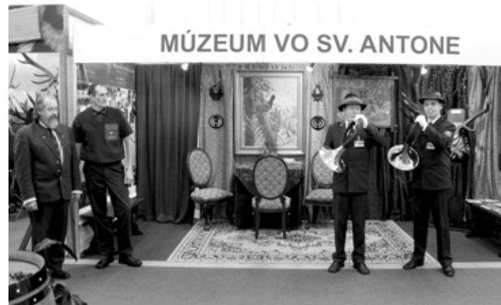
Stánok Múzea vo Sv. Antone na veľtrhu