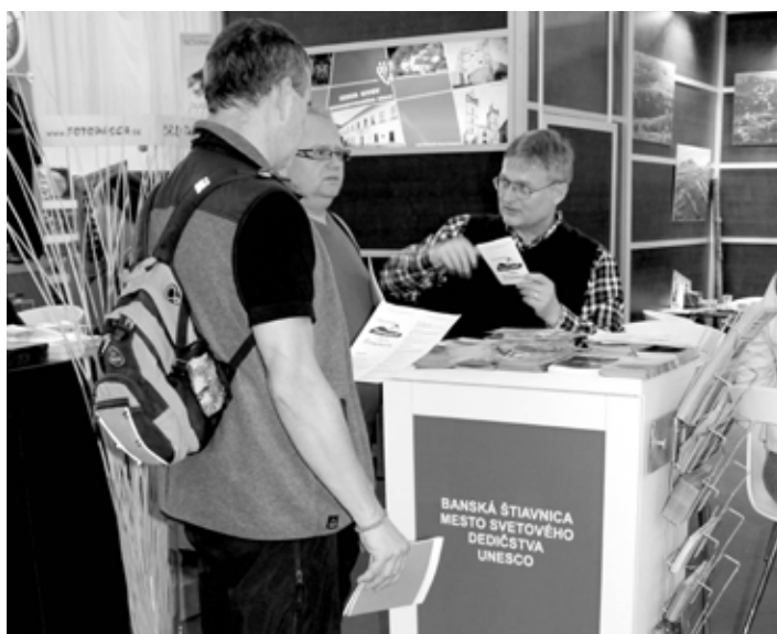
Prezentácia Banskej Štiavnice

Tento rok sa na veľtrhu predstavilo viac ako 400 vystavovateľov z viac ako 20 krajín. Okrem Slovenska sa prezentovali aj Česká republika, Taliansko, Nemecko, Poľsko, Veľká Británia, Turecko, ale aj africké krajiny ako Egypt, Tunisko, Namíbia. Svoje stánky tam mali aj cestovné kancelárie, letecké a prepravné spoločnosti a tiež predajcovia cestovného poistenia. Súčasťou veľtrhu boli aj výstavy Wellness