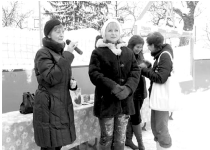
Primátorka nášho mesta otvára karneval

Karneval otvorila primátorka mesta a riaditeľ školy. Po ich príhovore nasledovalo pochovávanie basy ako rozlúčka za časom naplneným hodovaním a zábavou. Masky od výmyslu sveta vytvorili húsenicu a pomaly sa každá, jedna po druhej, predstavovali porote, zloženej zo zástupcov rodičov. Fantáziu predviedli deti aj