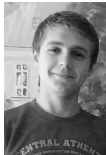
nym iným Valentínom, okrem svojho otca, nestretol.