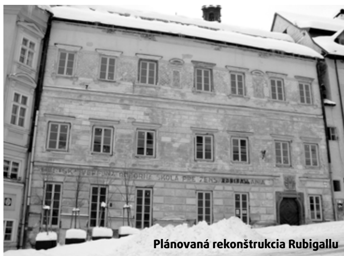
Plánovaná rekonštrukcia Rubigallu

Prípravujeme rekonštrukciu Ul. Krčméryho na Štefultove s celoplošnou povrchovou úpravou, na čo bola v roku 2012 vypracovaná projektová dokumentácia. V rámci programu Leader budeme realizovať dve akcie, a to vybudovanie parku na sídlisku Drieňová v sume 40 133,03 € a rekonštrukciu autobusových zastávok v sume 23 035,63 €. Ďalej budeme pokračovať v realizácii stavebných prác v rámci projektu „Zavedenie efektívneho systému separovaného zberu.“ V roku 2013 budú pokračovať práce na projektovej do-