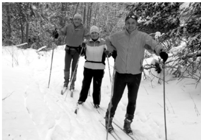
Bežkárske radosti zimy

A aj keď mnohí vodiči už s touto zimou strácajú trpezlivosť, ŠPZ-ky na asi päťdesiatke zaparkovaných áut v sobotu v okolí Červenej studne prežrádzali, že krásy bielej stopy si k nám prišli vychutnať aj návštevníci z Bratislavy, Nitry, Levíc, Nových Zámkov, Banskej Bystrice, Zvolena, Žarnovice, ale aj turisti z Českej a Maďarskej republiky. Veľmi príjemným prekvapením, najmä pre nás domácich vyznávačov tohto úžasného športu, ktorí sme si doteraz stopu vytvárali a udržiavali s pomocou (niekedy aj krvopotne),