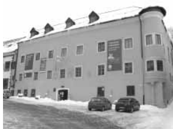
Informačné centrum sa nachádza v budove Bergerichtu, na prízemí.

Informačné centrum Banská Štiavnica, situované na Nám. sv. Trojice, prevádzkujú spoločne Mesto Banská Štiavnica a Slovenské banské múzeum. Spojenie týchto organizácií prinieslo lepšiu orientáciu pre turistov a komplexnejšie podávanie informácií, čo sa týka mesta a jeho zaujímavostí, možností turistického využitia, informácií o expozíciách všetkých múzeí v meste a jeho okolí a pod.