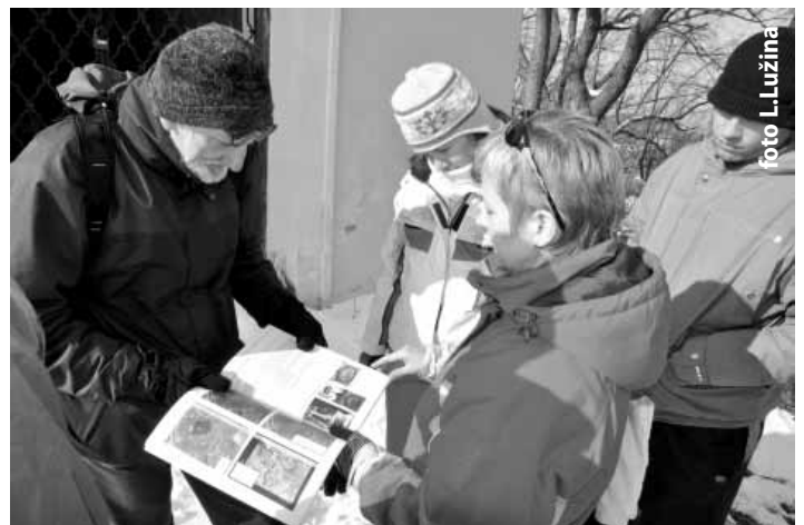
Svetový deň sprievodcov si pripomíname už od roku 1990.

Je len smutné, že v našej krajine treba mať všade strážcov. V minulosti sa našlo množstvo štedrých darcov, ktorí finančne prispievali a usilovali sa kaplnky udržiavať v dôstojnom stave. Medzi nimi bol napríklad aj rímsko-nemecký cisár František I. Štefan Lotrinský, mnohí Štiavničania, ale i cudzinci žijúci v meste. Taký istý spôsob pomoci si už našiel cestu aj do súčasnosti. Viacerí Štiavničania a organizácie zo Slovenska a zo sveta prispeli na obnovu Kalvárie. Ak máte aj vy záujem podať pomocnú ruku a ste ochotní prispieť, verte, že pomôžete správnej veci. Plány do budúcnosti sú skvelé a držíme palce všetkým snaživým a zapáleným ľuďom, aby sa im podarilo všetky záchranné práce na Kal-