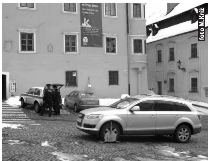
Parkovanie pod Morovým stĺpom a pred Bergerrichtom na Námestí sv. Trojice je podľa platného VZN zakázané.