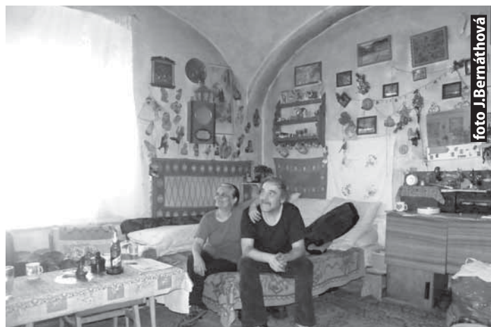
Obyvatelia opustenej sýpky sú šťastní zo strechy nad hlavou.

Už dávnejšie som si všimla postavy putujúce k starej opustenej sýpke, ktorá sa týči na kopci v blízkosti Komorovských jazier. Medzi obyvateľmi Povrazníka sa o nich poľuškovávalo kadečo. Bola som veľmi zvedavá, aká je skutočnosť, a tak som sa tam, samozrejme v sprievode osobného ochrancu, vybrala. V hlbokom snehu vyšliapaný chodník, smerujúci k provizórnym vchodovým dverám ošarpanej budovy, mnohé naznačoval. Najskôr nás privítali štvornohí miláčikovia „domáceho pána“ a hneď na to nás už sám veľmi zdvorilo pozýval do skromného príbytku na kávu. Príjemne vykúrená a útulne zariadená klenbová miestnosť vo vnútri sýpky bola pre nás poriadnym prekvapením. Na oknách pekné záclony, steny zdobiace obrazy a poličky so suvenírmi od výmyslu sveta, knižnička, pohodlná gaučová súprava s konferenčným stolíkom, spálňová časť, provizórna kuchynka, malá kovová piecka, na ktorej bol rozvarený skromný obed. Atmosféru interiéru dotvárali staršie perzské koberce a príjemná hudba z rádia, napojené-