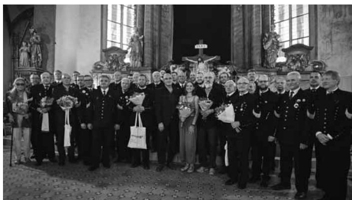
Spevokol Štiavničian v Kostole sv. Kataríny