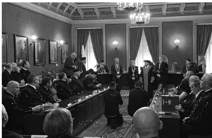
Otvorenie osláv