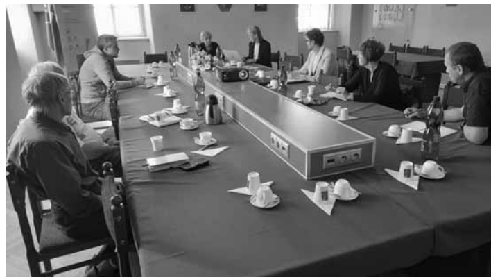
Pracovné stretnutie na radnici

Členmi pracovnej skupiny sú vlastníci pozemkov, na ktorých sa banské jarky nachádzajú, medzi nimi napríklad Mesto Banská Štiavnica, Obec Štiavnické Bane, Rudné bane, š. p., Slovenský vodohospodársky