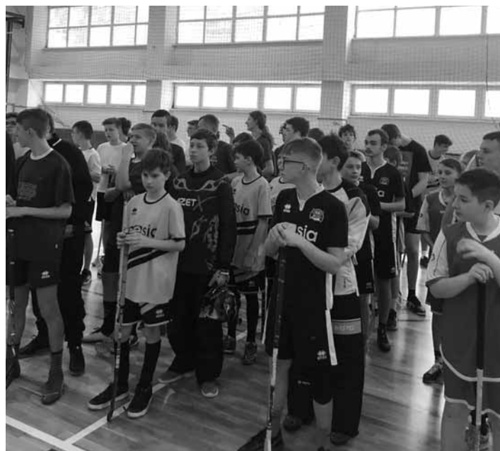
Florbalové družstvá žiakov ZŠ