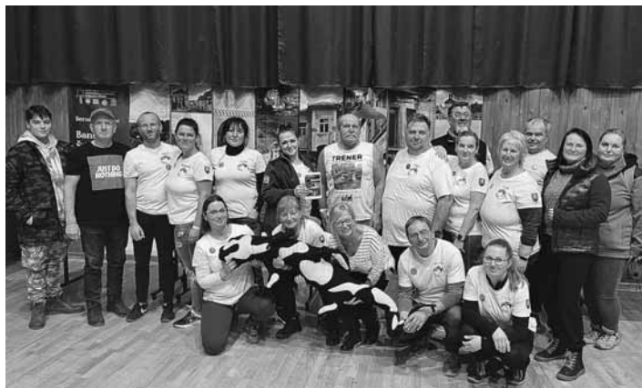
„Ľadové medvede“ Jašterice zo Štiavnice