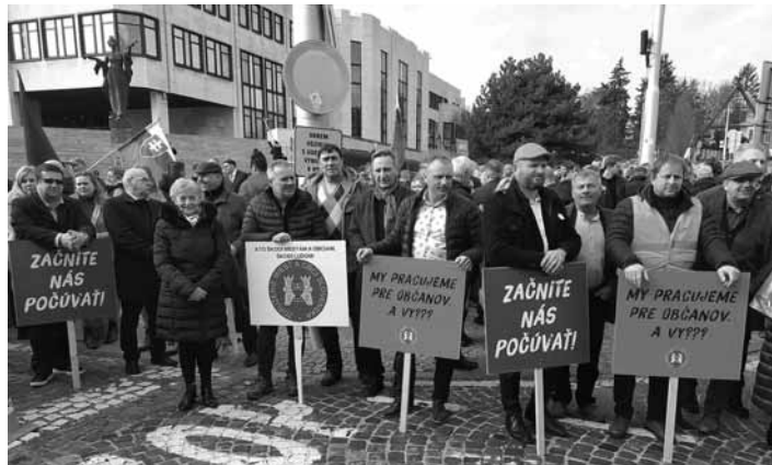
Predstavitelia RZMO Žiarsky región na proteste samospráv

Zúčastnili sa ho zástupcovia miest a obcí z celého Slovenska, aby protestovali proti nesystémovým riešeniam Vlády SR, ktoré samosprávam nepomáhajú, ale naopak, škodia. Protestu sa zúčastnili aj zástupcovia Banskej Štiavnice. 3.str.