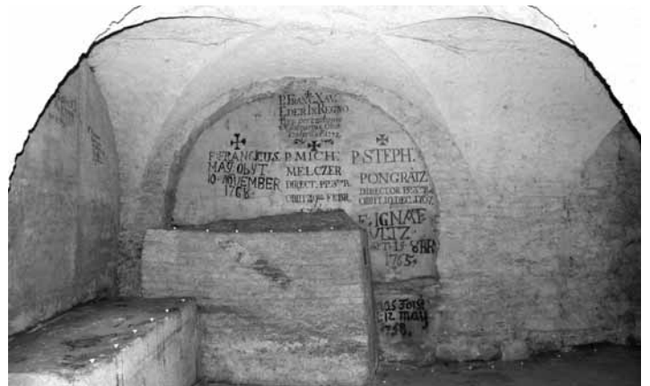
Hrob E.-Xaverského v katedrálnej krypte

V redukciách našlo útočisko okolo 200 000 indiánov najmä z kmeňa Guarani. Autorita katolíckej cirkvi poskytovala ochranu pred španielskymi a portugalskými lovcami otrokov a hľadačmi zlata. V redukciách boli všetci indiáni a jezuiti rovnocenní a slobodní občania. Každá rodina mala kúsok pôdy, ktorý obrábala, ale nevlastnila ho. Najviac pôdy sa obrábalo spoločne (za spevu nábožných piesní), úroda sa odkladala v spoločných sýpkach a delila sa rovnomerne