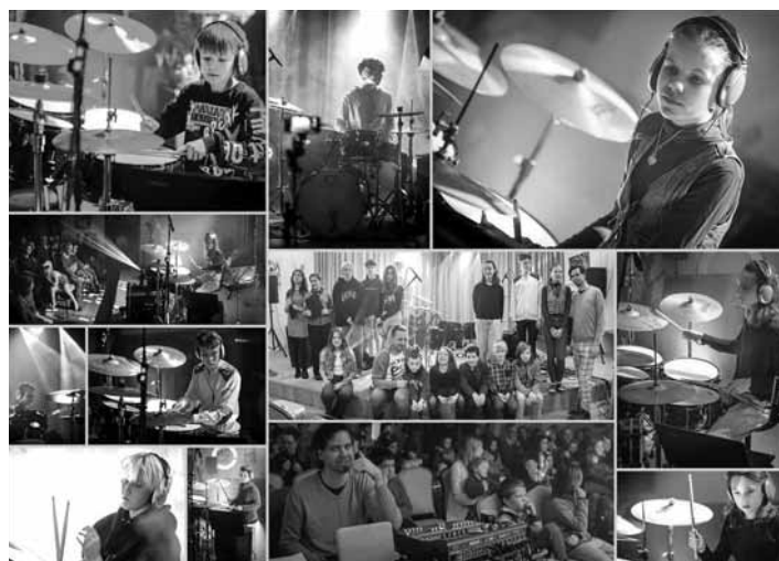
Fotokoláž z bubenického koncertu