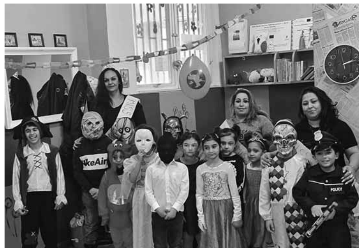
Pestré karnevalové masky

Aj takéto masky mali pripravené deti z lokality Šobov na karne-