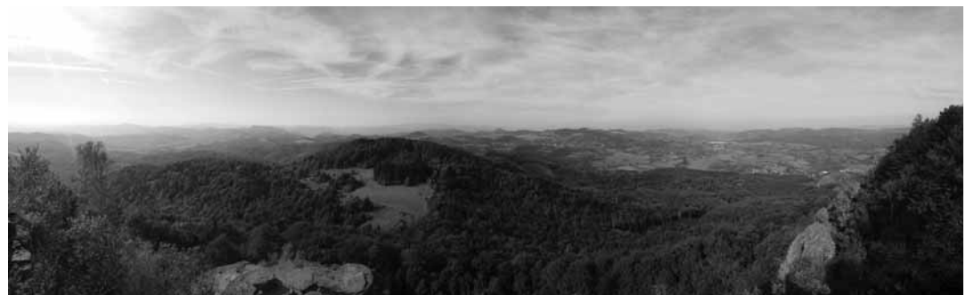
Pohľad zo Sitna