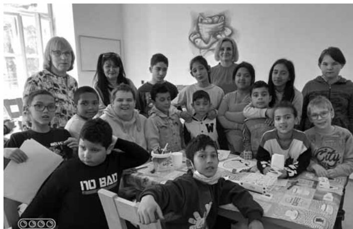
Deti zo ŠŽŠ v BŠ

Domov Márie v Banskej Štiavnici pripravil v priebehu týždňa od 13. do 19. marca 2023 viacero podujatí. Prvoradí sú vlastní prijímatelia sociálnej služby, pre ktorých boli pripravené aktivity počas celého týždňa - prednášky, tréning mozgu kognitívnymi a pohybovými cvičeniami, lúštením krížoviek, riešením hlavolamov, pracovných listov a hádaniek, privolaním spomienok