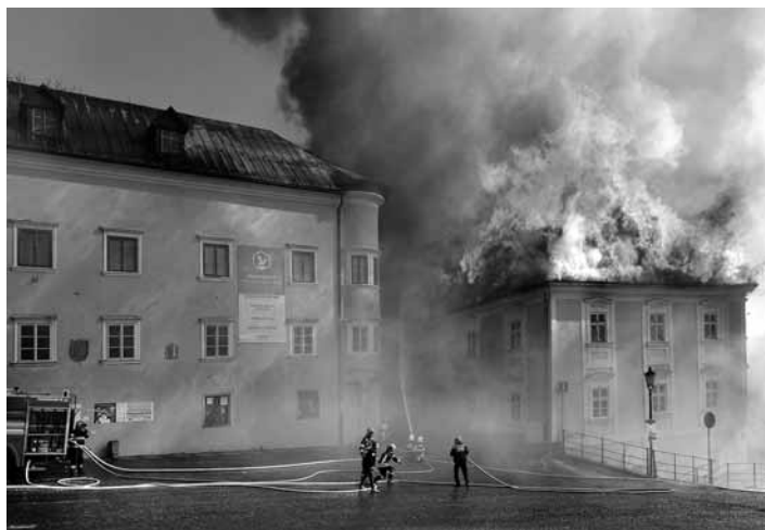
Hasenie požiaru na ZUŠ