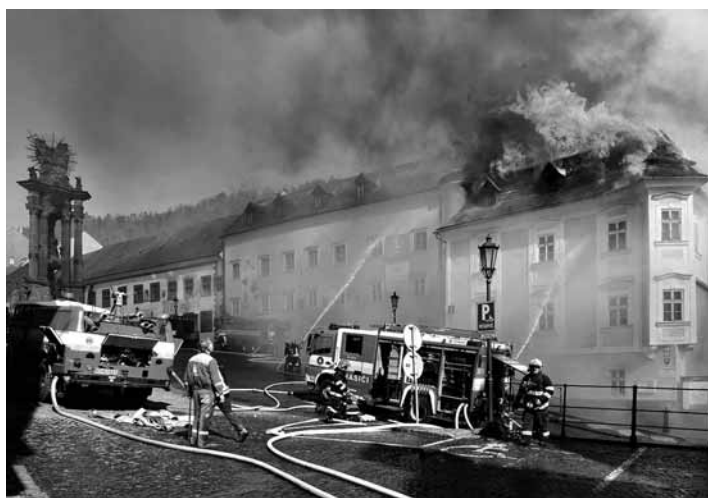
Ničivý požiar zasiahol až 7 budov

Ministerstvo vnútra prostredníctvom Okresného úradu Banská Štiavnica naďalej metodicky riadi, usmerňuje, koordinuje a monitoruje situáciu na základe požiadaviek mesta a spolupracujúcich organizácií v rámci možností a kompetencií OÚ v zmysle platnej legislatívy. Zo strany odboru krízového riadenia Okresného úradu Banská Štiavnica boli poskytnuté aj celtové plachty na ochranu odkrytých priestorov a k dispozícii sú aj priestory okresného úradu na prípadné uloženie listín zo zasiahnutých budov.