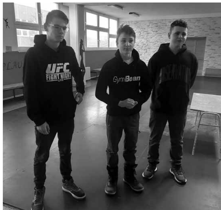
Úspešní riešitelia zo ZŠ J. Horáka