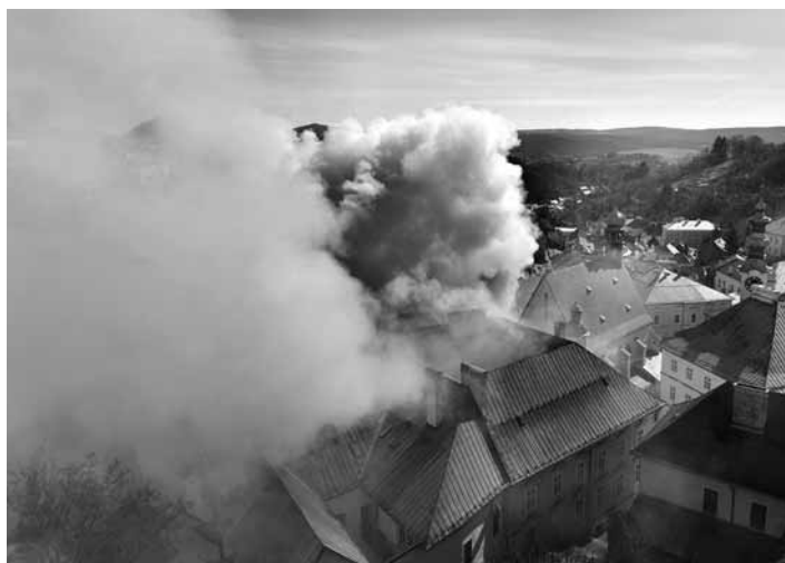
Požiar sa širil od Banky lásky

Komplexná pomoc pre mesto Banská Štiavnica bude predmetom výjazdového rokovania vlády, pričom