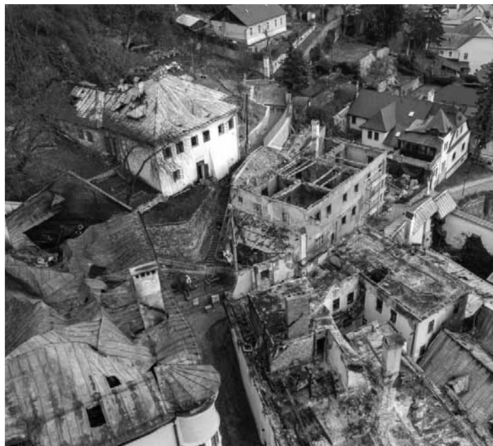
Pohľad na zhorené budovy v centre mesta 3.str.

V úvode svojho listu pripomenula význam Banskej Štiavnice v histórii i súčasnosti Slovenska. Zdôraznila, že naše mesto a technické pamiatky jeho okolia sú 30 rokov na Zozname svetového dedičstva UNESCO. Pripomenula, že tým prekročil význam nášho mesta slovenské hranice. V ďalšej časti listu požiadala vládu i parlament o nielen deklaratívnu, ale aj praktickú pomoc mestu. Zdôraznila, že „bez konkrétnej časovej, finančnej a kompetenčnej schémy bude obnova neúčinná, zdĺhavá a nekoordinovaná, čo nemôžeme dopustiť.“