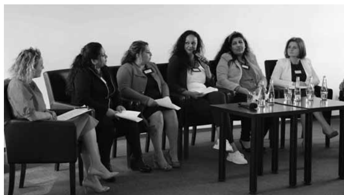
Konferencia NP v Spišskej Novej Vsi

Už v roku 2021 vypracovali akčný plán na odstránenie havarijného stavu spoločných priestorov bytových domov. Cieľom akčného plánu bolo zlepšenie podmienok bývania MRK, zamedzenie vzniku úrazov a zlepšenie vzhľadu byto-