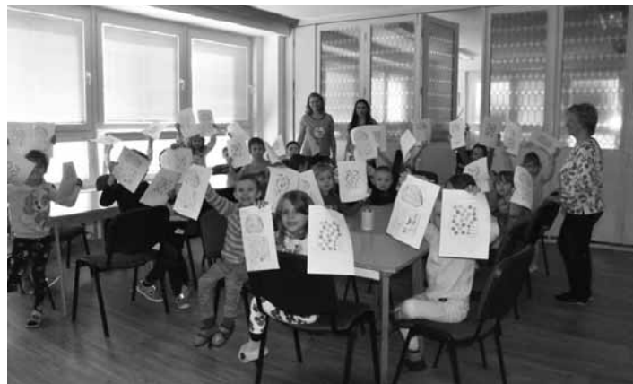
Deti trénovali mozog