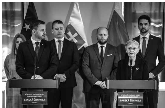
Tlačová konferencia

Vládny kabinet mal v programe pomoc mestu po požiari, ktorý vypukol v centre mesta 18. marca 2023 a spôsobil rozsiahle škody. Viacerí ministri vrátane dočasne povereného predsedu vlády Eduarda Hegera, prišli v deň požiaru do Banskej Štiavnice, aby pomohli a jasne zadeklarovali, že vláda pomôže mestu s odstraňovaním následkov, či už finančne alebo aj materiálne.