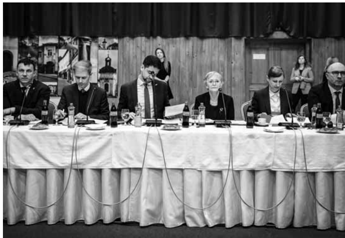
Rokovanie vlády SR v KC

B.1. s vyčlenením finančných prostriedkov pre kapitolu Ministerstvo vnútra SR a Ministerstvo životného prostredia SR do sumy 7 000 000eur na roky 2023 až 2025 a ich použitím účelovo viazaným na odstránenie následkov ničivého požiaru v Banskej Štiavnici; B.2. s poskytnutím finančných prostriedkov z rozpočtovej rezervy vlády SR v roku 2023 mestu Banská Štiavnica do sumy 4 000 000eur a ich použitím účelovo viazaným na odstránenie ná-