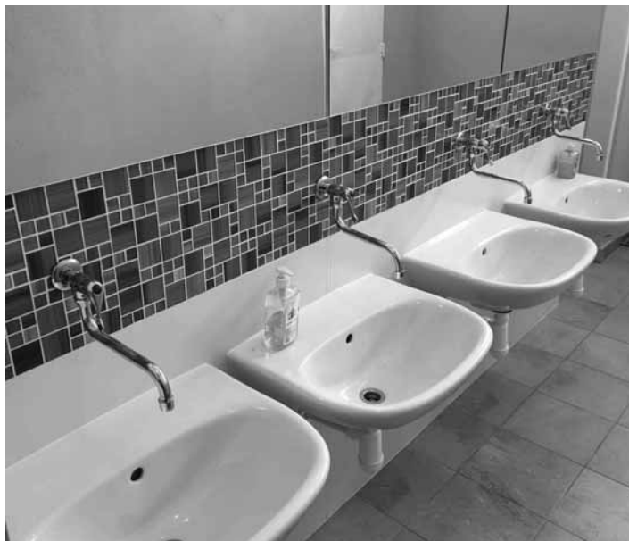
Nové sociálne vybavenie školy