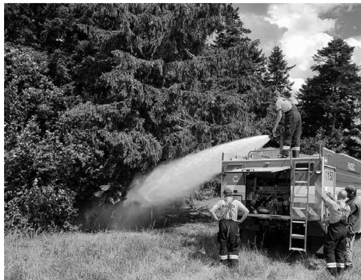
Hasenie požiaru v našich lesoch

Lesy sú prirodzeným prostredím celého spoločenstva živočíchov a rastlín. Je dôležité poznať tieto vzťahy, rozumieť im, pretože len tak ochránime a zabezpečíme seba a našu budúcnosť. Hospodárenie v lesoch sa riadi odborným Programom starostlivosti o les, ktorý zostávajú lesníci odborníci rôznych lesníckych inštitúcií a zároveň kontrolujú jeho plnenie a spôsob vykonávania. V priebehu vývoja lesa sa zásahmi lesníkov odstraňujú jednotlivé vetrom vyvrátené, polámané, odumreté a odumierajúce, hmyzom a hubou napadnuté nezdravé a hos-