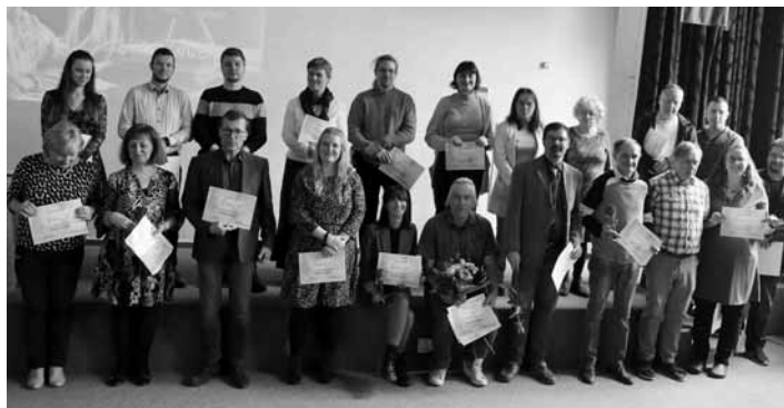
Ocenení učiteľia v GAK BŠ