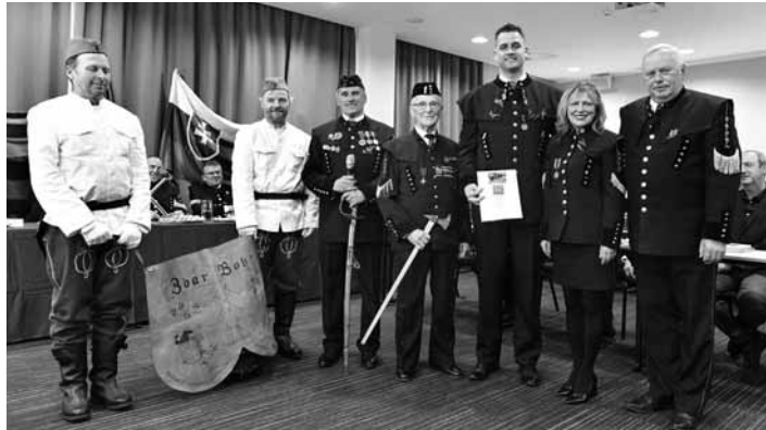
Slávnostný šachtág v Hodruši-Hámroch