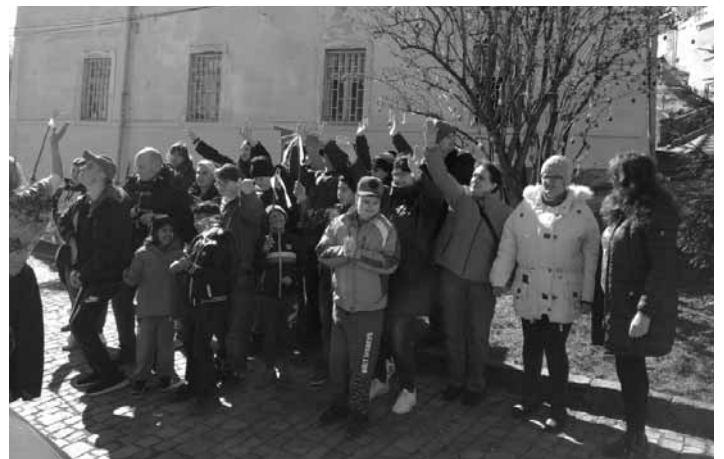
Výzdoba veľkonočného stromu pred ŠZŠ