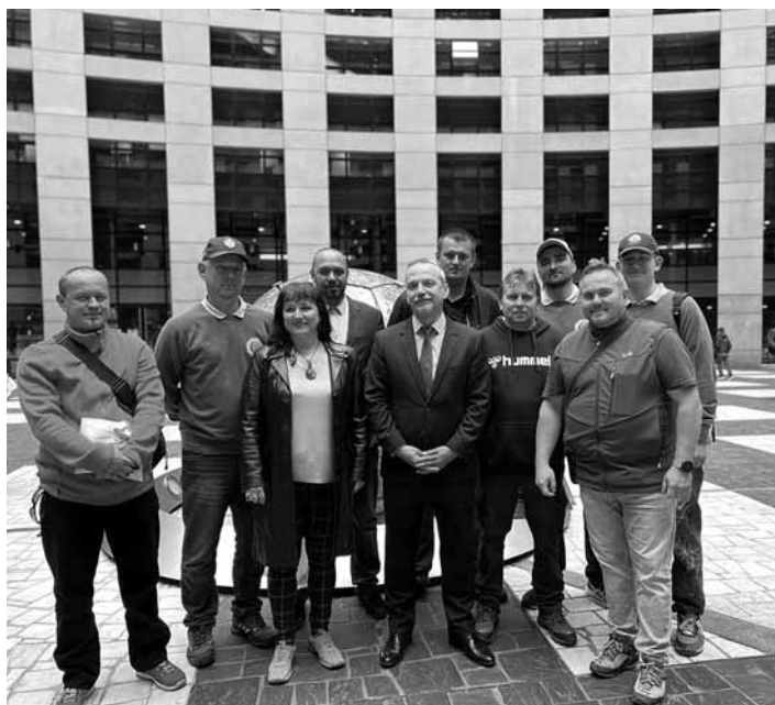
Dobrovoľní hasiči s europoslancom