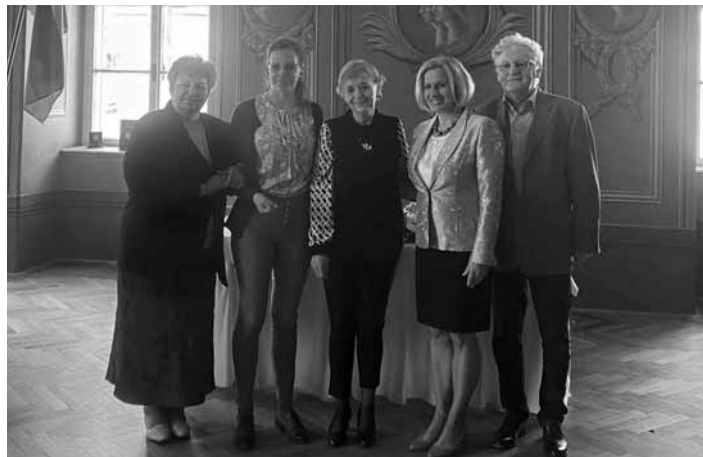
Delegácia z Tatabánye na prijatí u primátorky mesta