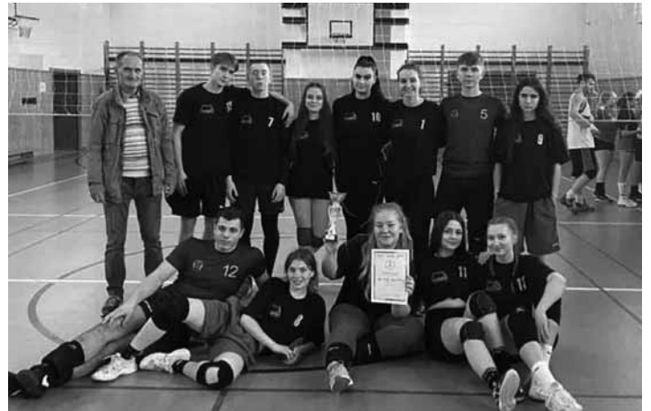
Volejbalové družstvo GAK BŠ

Po prvýkrát sa hral volejbal v netradičnej súťaži mix-volejbal v zostave 3 chlapci a 3 dievčatá. Regionálne kolo sa neuskutočnilo z dôvodu zlého systému celého slovenského športu na školách, ktoré sa nedá inak nazvať ako chaos systém na posledný termín. Na prvý zápas nastúpili proti nám gymnazisti z Detvy. Bol to zápas, kde sa len oťukávali, hlavne v prvom sete, veľa stratených bodov pri podaní, smečovaní a príjme. Zápas sa hral na dva víťazné sety, v prvom sete sme vyhrali 25:16 a druhý set 25:9. Druhý zápas s Gymnáziom L. Štúra Zvolen bol veľmi ťažký. V prvom sete sme prehrali 16:25, ale v druhom sete sa zlepšilo smečovanie, bloky, isté podanie a hlavne dobrý príjem, a tak sme v koncovke do-