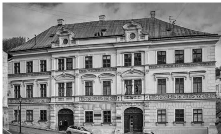
Sídlo Slovenského banského archívu

Rozpočtovým opatrením č. 92/2023 dostalo Ministerstvo vnútra SR finančné prostriedky v celkovej výške 804 275,00EUR v súlade s uznesením vlády SR číslo 142/2023. Z celkovej sumy je 781 000EUR vyčlenených na renováciu budov, objektov alebo ich častí, a to vrátane strechy, elektroinštalácie, podláh, maľby, fasády a okien. Do tejto sumy je tiež zahrnutá likvidácia, uloženie a odvoz odpadu a následné upratanie objektu. 12 000EUR je vyčlenených na údržbu protipožiarnych zariadení.