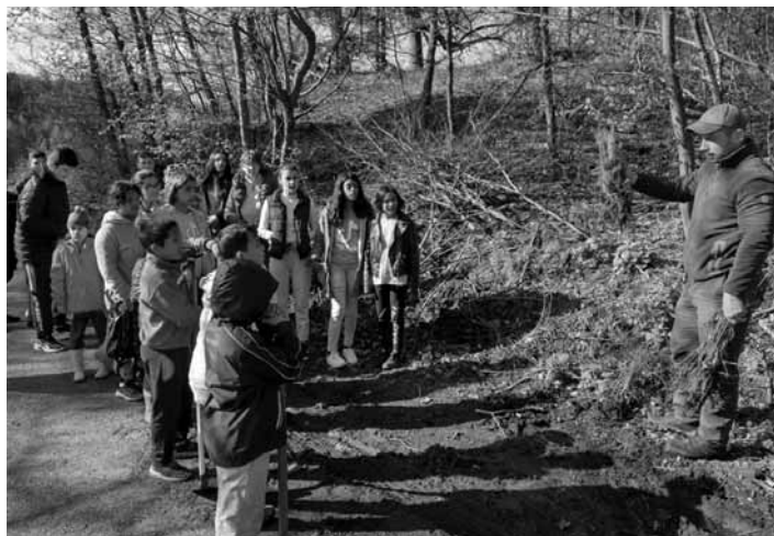
Žiaci ŠZŠ pri výsadbe stromčekov