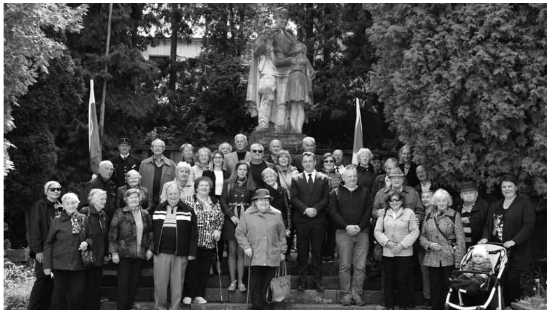
Účastníci spomienkových osláv pred pamätníkom