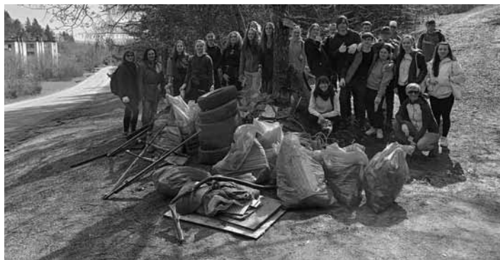
Vyzbieraný odpad dobrovoľníkmi - študentmi