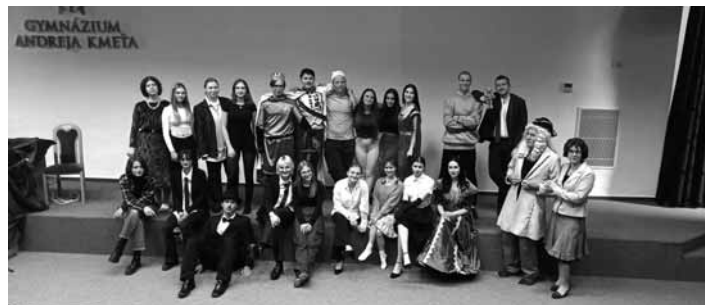
Talenty z GAK BŠ

Aula gymnázia bola zaplnená do posledného miesta a veru, bolo sa na čo pozeráť. Nielen žiaci obdivovali talent svojich spolužiakov ako hercov, ale divákmi boli aj žiaci z iných štiavnických škôl. Nádherné kostýmy, herecké i spevácke výkony, to všetko presvedčilo divákov, že do dejín sa dá nazrieť aj trochu inak. Žiačka po slovensky odpovedá pred tabuľou a pani učiteľka jej kladie otázky. To je tradičné vyučovanie, ktoré však oživia historické i literárne postavy z minulosti, ako napr. Asterix, Obelix, kráľ Artuš, Mer-