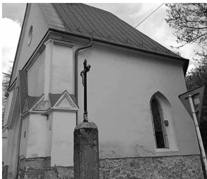
Kaplnka sv. Alžbety pred obnovou

V polovici 16. storočia, bol kostol prestavaný na mestskú bránu tzv. Antonskú (Krupinskú). V roku 1875 bola brána zbúraná a zachovaná svätyňa kostola bola stavebne upravená na kaplnku. V rokoch 1894 -1895 bola realizovaná reorganizácia objektu (interiérová výmalba, osadenie vitrážnych okien a podobne). V priebehu 20. storočia a najmä v jeho druhej polovici boli realizované stavebné úpravy – osadenie sokľového obkladu z travertínových platní, realizácia odtokového žlabu v betónovom lôžku po obvode.