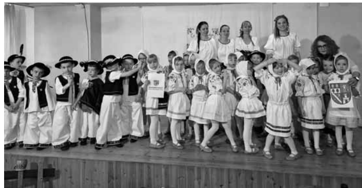
Detský folklórny súbor Čistinka