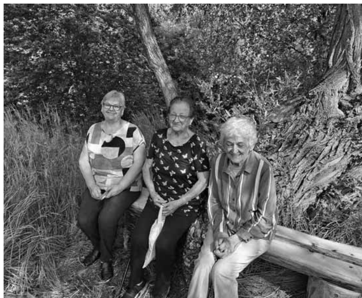
Drevené lavičky potešili aj seniorov

Mestské lesy Banská Štiavnica, spol. s r.o.