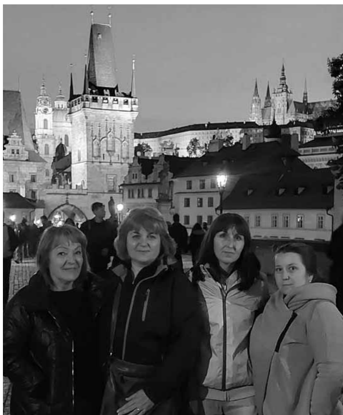
P. uč. zo ZŠ J. Horáka v Prahe