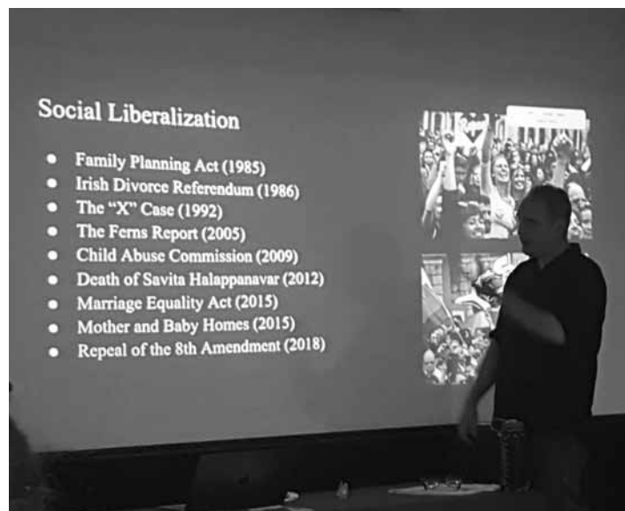
Výučba pedagógov v írskom Dubline

Dvaja pedagógovia odborných predmetov absolvovali mobility formou výučbových kurzov v zahraničí s názvom Collegiality Across C.L.I.L. v írskom Dubline a vyučujúca informatiky absolvovala kurz Robotic and Stem in Schools v gréckom meste Kerkyra. Zámerom mobility bolo vybaviť učiteľov informatiky metodikami a novými poznatkami z oblasti robotiky a zabezpečiť odbornú didaktickú prí-