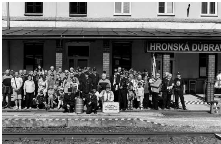
Účastníci stretnutia pred stanicou Hr. Dúbrava

vo Zvolene s finančnou podporou Mesta Banskej Štiavnice a Železníc Slovenskej republiky. Po tradičnom fotografovaní sa vláčik s dvomi vozňami 2. triedy, z ktorých jeden bol bufetový, pohol smerom do Banskej Štiavnice. Cestujúcich obšťastňovali Nácko a Lojzo írečtými vtípmi, spevy intonovali členovia spevokolu Štiavničian a tohtoročný jubilant Erik Sombathy, ktorému bolo podujatie venované, posilňoval cestujúcich aj ostrejším trúnkom. Po zastávkach v Ko-