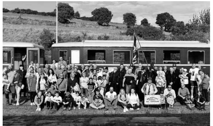
Účastníci stretnutia pred „Štiavnicou Ančou“