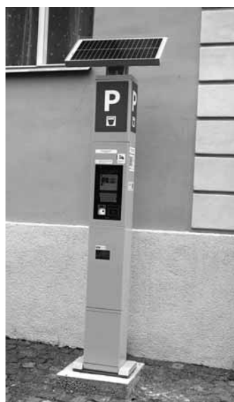
Parkomaty pri skanzene a pod Kalváriou