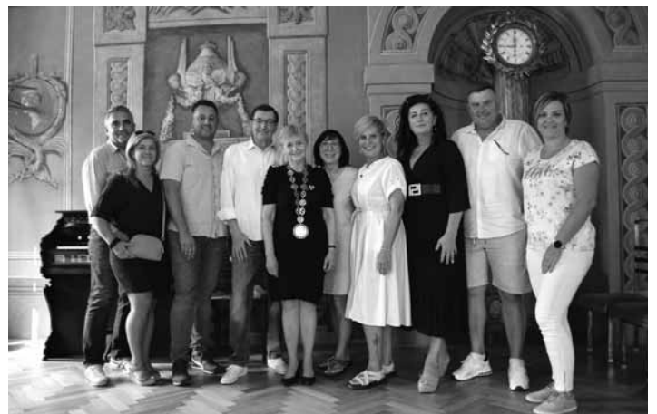
Delegácia v obradnej sieni radnice

Primátorka mesta vo svojom príhovore vyzdvihla, že si veľmi váži pomoc z Českej republiky, ktorá prišla v čase, keď naše mesto zasiahol živelný požiar 18. marca, ktorý zničil historické budovy v centre mesta. Ako uviedla: „aj napriek tomu, že sa naše krajiny rozdelili, vždy sme zostali priateľmi a vzájomné vzťahy sú nadštandardné“. Nasledoval zápis do pamätnej knihy návštev mesta,