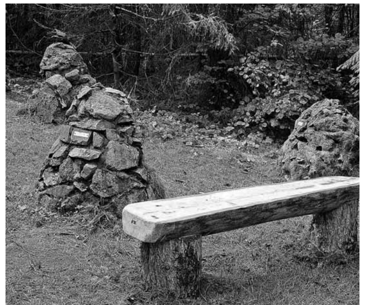
Nová drevená lavica na NCH Paradajs

Mestské lesy Banská Štiavnica, spol. s r.o.