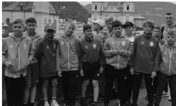
Futbalisti U11 na turnaji v Salzburgu