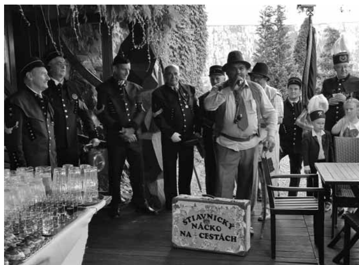
Štiavnický Nácko na terase baníckej krčmy