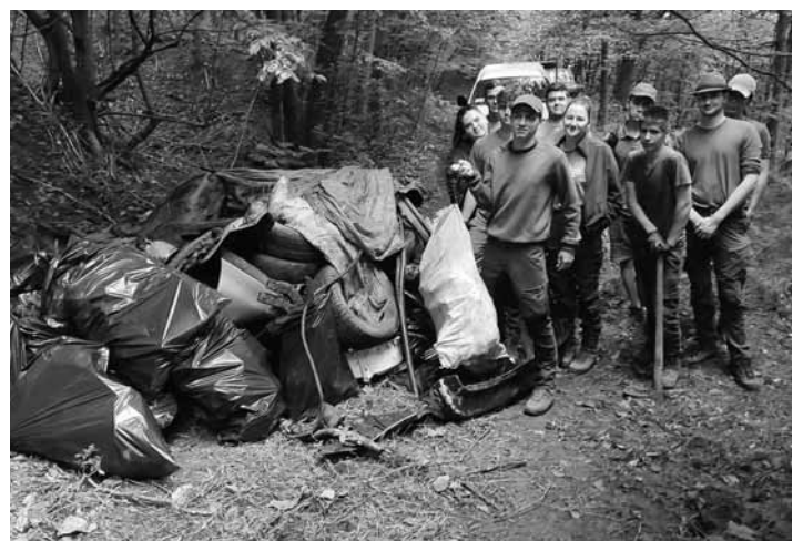
Vyzbieraný odpad z našich lesov

Mestské lesy Banská Štiavnica, spol. s r.o.