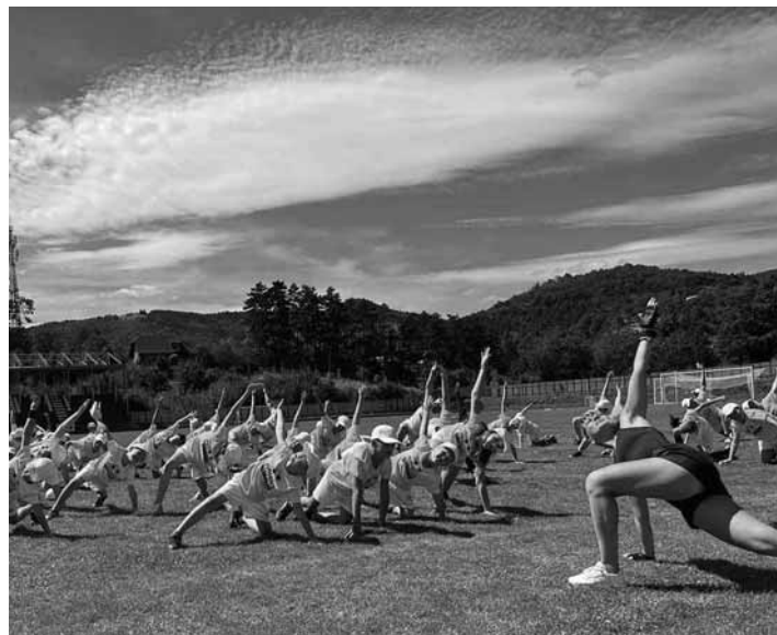
Pohybové aktivity detí na atletickom štadióne