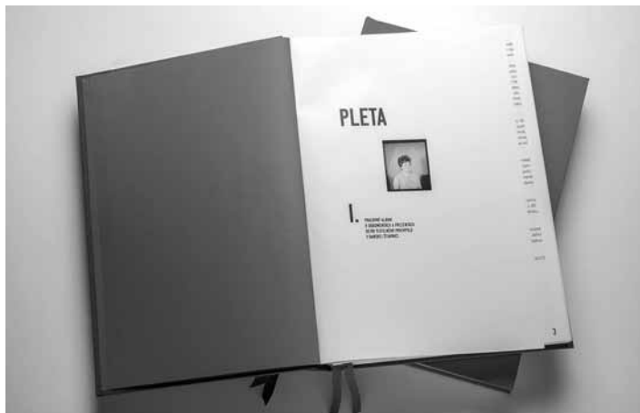
Ukážka „Pracovného albumu“

V roku 2023 v spolupráci Slovenského banského múzea, Kultúrno-turistického centra Hájovňa a bývalých a súčasných zamestnancov banskoštiavnických textilných podnikov, vznikol tzv. Pracovný album k projektu dokumentácie a prezentácie dejín textilného priemyslu v Banskej Štiavnici (Pracovný album).