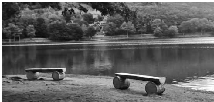
Drevené lavičky okolo jazera