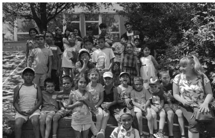
Deti zo Šobova na letnom tábore

Dobrovoľníci z občianskeho združenia Ďakujem- „Palikerav“ spolu s organizátorom tábora (Slovenské literárne centrum) deťom pripravili bohatý program. Deti sa zúčastnili literárnej besedy s prekladateľmi severských jazykov a súťažili o knižky. Navštívili neďaleké ZOO, kde si pozreli výcvik psov, pernaté dravce, krokodíla, či opice. Deti boli nadšené z koncertu formácie Hills Bros a tešili sa aj predstaveniu bábkového divadla. V provizórnom kine sledovali film, nechýbalo ani záverečné tanečné vystúpenie a diskotéka.