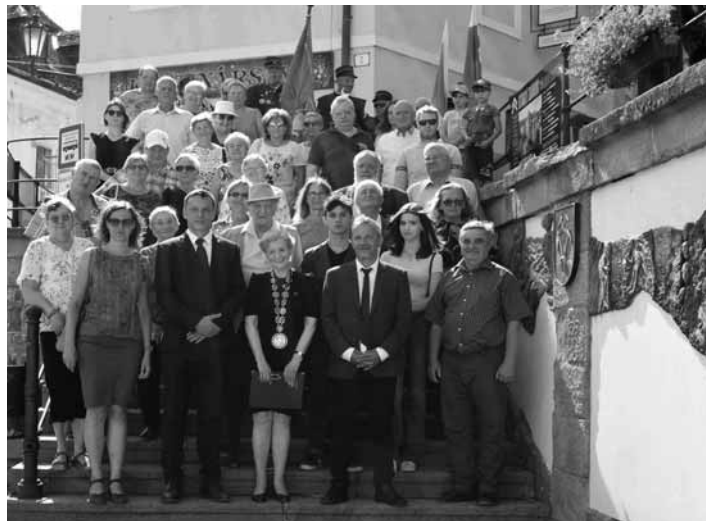
Účastníci spomienkových osláv