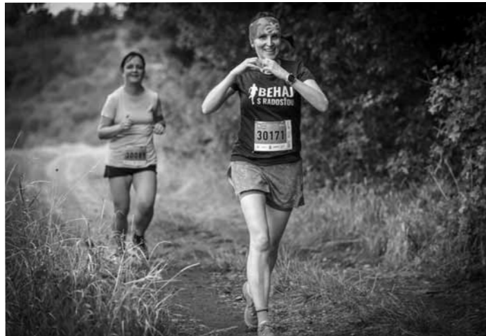
Príhlás sa aj ty!

aj silnou ekologickou myšlienkou. Hlavným partnerom ekológie sú aj v tejto lokalite lekáreň Dr. Max, ktoré zaisťujú napríklad štartovné tašky rozložiteľné v horúcej vode. Veľmi dobre známu vecou medzi bežcami sú aj tzv. speedcupy, znovupoužiteľné občerstvovacie kelímky, ktoré majú všetci bežci vďaka lekárniam Dr. Max zadarmo. Medaile pre bežcov sú vyrobené z rozložiteľného bioplastu, ktorý má svoj základ v kukurici a obilovinách. Me-