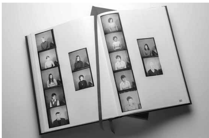
Fotografický album podniku Pleta