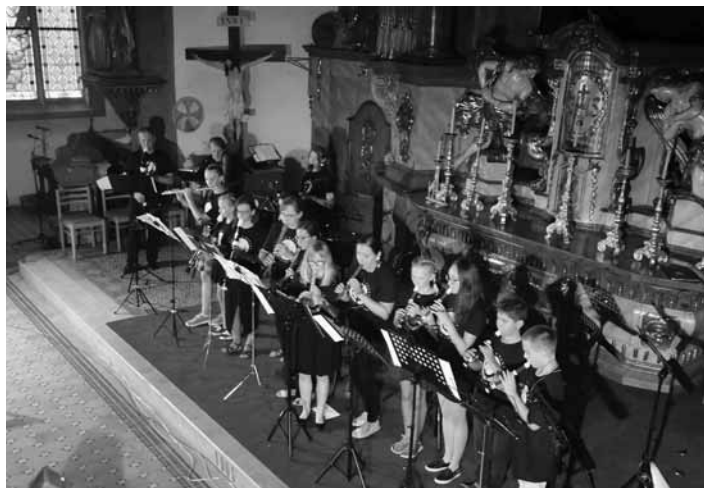
Koncert v Kostole sv. Kataríny

oblasti kultúry a vzdelávania prinešť sa javí ako zmysluplná.