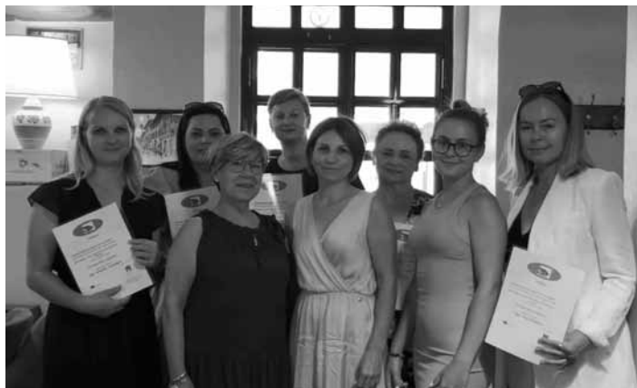
Pedagógovia za poznáním a gastronómiou

V rámci mesta sme spoznávali predovšetkým vybrané reštauračné zariadenia, a mali tak možnosť porovnať fungovanie služieb, degustovať typické lokálne výrobky, či zažiť pravé talianske raňajky v kafetériách. Počas ďalších dní sme absolvovali didaktic-