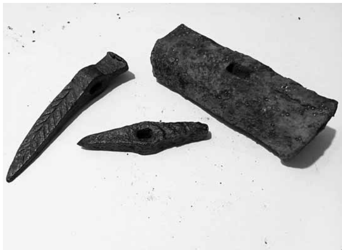
Neoddeliteľné súčasti baníckej práce

stali najpoužívanejšími baníckymi nástrojmi až do obdobia vrcholného stredoveku. Práve v tomto období prichádza k veľkému rozšíreniu ťažby na území Slovenska a aj konkrétne v Štiavnických vrchoch. Neznamená to však, že sa ďalej vôbec nepoužívali. Ako si môžeme všimnúť na náleзоch „naše“ banícke čakány pretrvávali, pričom na jednej strane mali špic, no druhá strana bola tupá (tzv. obuch). Môžeme to považovať za univerzálne riešenie. Tupou stranou sa mohlo udierať po klíne, železku, a teda mohli v rámci potreby aj suplovať použitie kladivka. Podmienky ťažby sa s rozmachom hlbinného dobývania menili, a preto nastal prirodzený prechod od primárneho používania čakana ku primárnemu používaniu kladivka a železka. Kladivko a železko malo pri hlbinej ťažbe v porovnaní s čakanom určité výhody. Patrila medzi nich lepšia pohyblivosť a spratnosť, keďže kladivko a železko nevyžadujú pre prácu dlhú ruku a priestor pre manipuláciu, ako čakány. Ďalšou nespornou výhodou bolo, že v prípade kladivka a železka sa dali ľahšie vymeniť opotrebované nástroje priamo v podzemí. Bolo o mnoho jednoduchšie doniesť si so sebou do podzemia niekoľko klinov, železok, ako niekoľko čakánov. Táto dvojica nástrojov sa tým pádom stala v období stredoveku dominantnou a po veľmi dlhú dobu zastáva silnú pozíciu v baníckej ikonografii. Aj tu sa však z pohľadu archeológie ukazuje zaujímavosť. Väčšina ľudí, ktorá sa témou hlbšie nezaobrá, by si mohla myslieť, že kladivká a železka sa vysky-