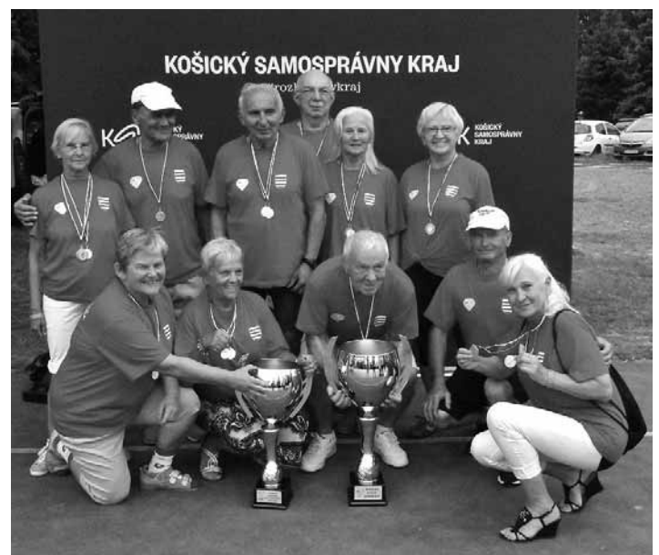
Športovci z JDS s trofejami

Celková bilancia 8 zlatých, 5 strieborných a 1 bronzová medaila je fantastický výsledok, ktorý nás