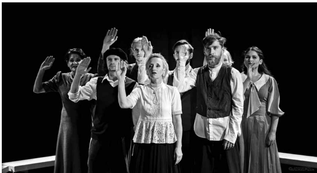
Svetoznámy Teatr KTO z Krakowa

Festival otvorí a entuziazmus do celého mesta prinesie 22-členný pochodujúci Orkest de Tegenwind, street brass band z holandského Utrechtu. Citový a zároveň veselý zážitok pre celú rodinu vytvorí mladá španielska akrobatka niMú v Jacuzzi, poeticko-cirkusovej show na lane. Španielske rytmy a temperament dovezie na festival aj vysoko senzibilná kapela MiraMundo z Barcelony, ktorá na koncerte zahrá jedinečnú world music do tancu. Svetoznáme šansóny a hity v podaní šarmantného dámskeho tria Cmorejová, Humeňanská, Baarová navodia sentimenty parížskych ka-