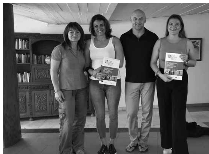
p. uč. absolvovali kurzy mobility

Pozitívna atmosféra, výmena názorov a zábava bola súčasťou procesu