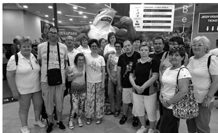
Klienti DSS v Tropikáriu, Budapešť

Mesto Banská Štiavnica poskytlo zo svojho rozpočtu dotáciu na projekt pod názvom: „My vo svete bez hraníc“. Prvou z nich bola návšteva Tropikária v Budapešti, ktorá sa uskutočnila 6. 7. 2023. Akcie sa zúčastnili prijímatelia sociálnych služieb spolu s ich rodičmi a personálom zariadenia. Bol to pre nás nezabudnuteľný zážitok, môcť na chvíľu prekročiť hranice a vidieť aspoň malú časť podmorského sveta. Liečivé účinky arteterapie a svoju kreativitu si naši prijímatelia mohli overiť v Dielničke SBM v Banskej Štiavnici, kde sme si v rámci Letnej školy vyrobili smaltované prívesky a tašky batikované voskom. Hotové výrobky boli opäť dôkazom