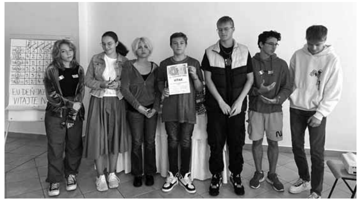
Vítavý „španielsky tím“ vo vedomostnom zápase

školský kvíz so zameraním na prehľad vedomostí z oblasti geografie, histórie, hudby, umenia ako takého, osobností a, samozrejme, aj gastronómie s orientáciou na celý európsky kontinent. Priam netradične sa darilo našim najmladším. Náš „španielsky tím“ v podaní prváčkov sa statočne popasoval s jednotlivými okruhmi a priam ukázkovo zvíťazil v tomto vedomostnom zápase. Gastronomický zážitok v podobe pizze, šalátov, neodmysliteľného olivového oleja s tradičnou