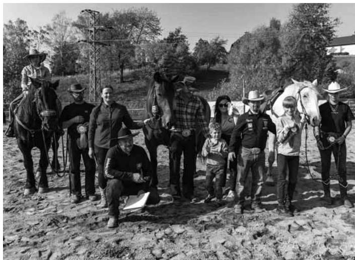
Tím Westernovej jazdeckej ligy