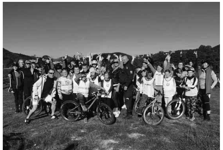
Cyklovýlet na Banský Studenec a Kolpašský tajch