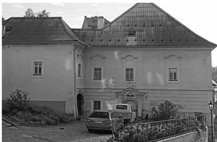
Farský úrad na ul. J. Palárika v BŠ

nosť sviatosti birmovania, pre našich birmovancov. To najdôležitejšie je postupné spoznávanie ľudí našej farnosti, ich potrieb, radostí i starostí, aby sme vedeli spolu s pánom kaplánom a farskou pastoračnou radou adekvátne reagovať na duchovné potreby nášho farského spoločenstva. Chcem nadviazať na usilovnú prácu môjho predchodcu a aj ďalších kňazov pôsobiacich predom mnou. Každý človek je iný a má svoje osobitosti, a tak iste budem mnohé veci robiť trochu inak, ale zatiaľ sa snažím správne uchopiť potreby farnosti, aby sme mohli spoločne duchovne rásť. Dobré a zaužívané veci neplánujem násilu meniť podľa svojich predstáv.