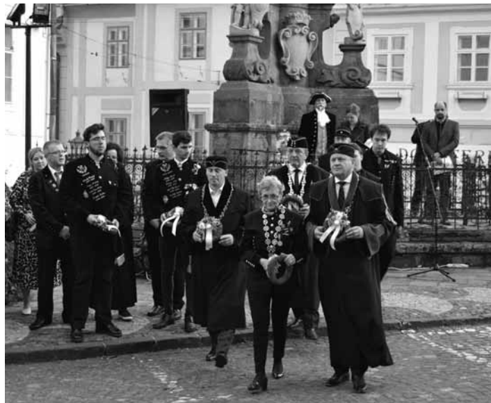
Položenie venčiek k plastike

V piatok 13. 10. 2023 do Banskej Štiavnice zavítali akademickí funkcionári a študenti nástupníckych univerzít/fakúlt Baníckej a lesníckej akadémie, aby sa zúčastnili 14. ročníka podujatia Akademici v Banskej Štiavnici 2023, ktorým sme si uctili tradície a duchovný odkaz tejto alma mater pre 11 nástupníckych univerzít a fakúlt, ktoré podpísali Deklaráciu pokračovateľov duchovného dedičstva slávnej Baníckej akadémie v Banskej Štiavnici.