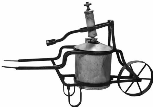
Hasičská striekačka – pumpa (1930)