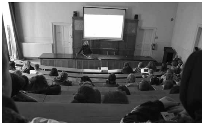
Prezentácia projektov v aule SŠ S. Mikovíniho

Ďalším typom projektov, do ktorých sme sa opätovne zapojili boli Mládežnícke výmeny, cieľom ktorých bolo nadobudnutie tzv. mäkkých zručností a kultúrne porozumenie. Študenti, ktorí počas pobytu nadviazali mnohé cenné priateľstvá a získali nové kontakty, prezentovali svoje skúsenosti, poznatky a zaujímavé zážitky. Zdôrazňovali, ako im táto medzinárodná skúsenosť pomohla zlepšiť sa v cudzom jazyku a naučiť sa tímovej spolupráci, zefektívniť komunikáciu a verejné vystupovanie, čoho prejavom boli aj tieto spontánne a autenticky prednesené prezentácie. Zaujímavou skúsenosťou bola aj adaptácia na nové kultúrne prostredie. Tieto tzv. mäkké zručnosti sú neoceniteľné ako v akademickom svete, tak i v profesionálnom a osobnom živote. Študentom pomôžu pri hľadaní zamestnania, pretože dnešní potenciálni zamestnávateľia vedia oceniť, ak sa uchádzač o zamestnanie prezentuje Youthpassom, čo je certifikát o absolvovaní takejto výmeny.