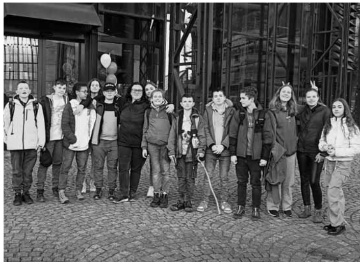
Žiaci ZŠ J. Horáka v Ostrave

Ako partnerskú školu sme si vybrali ZŠ Františka Formana. Naši žiaci pripravili pre svojich českých spolužiakov zaujímavé prezentácie, v ktorých im predstavili Banskú Štiavnicu i našu školu. Ako témy prezentácií si vybrali historické pamiatky, tajchy a sedem divov nášho mesta. Nechýbalo náučné video, v ktorom žiaci predstavili stále fungujúcu baňu Rozáľku, našich českých partnerov svojimi príbehmi pobavil aj Nácko a Hanzo či autorská pieseň i básneň z pera našich žiakov.