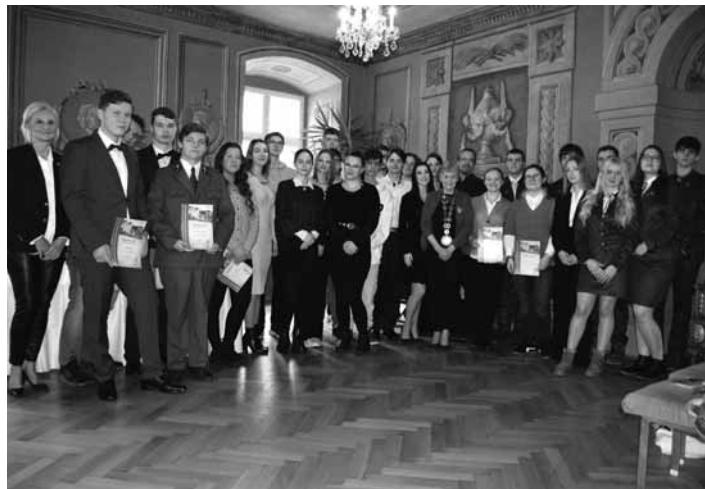
Študenti škôl s primátorkou na radnici

V obradnej sieni Mestského úradu sa stretlo 32 mladých osobností, ktorí sú nielen vynikajúcimi žiakmi, ale aj dôstojnými reprezentantmi svojej školy a mesta, v ktorom študujú. Pani primátorka vyzdvihla ich schopnosti, húževnatosť, trpezlivosť pri štúdiu, ale aj vedomosti a talent pri nespočetných školských i mimoškolských aktivitách, často aj na celoslovenskej úrovni.