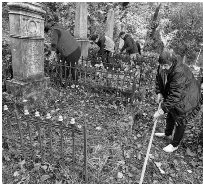
Odídenci z Ukrajiny pri úprave hrobov na cintoríne