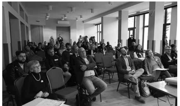
MsÚ Primátorka s poslancami MsZ na odbornej konferencii

k zavádzaniu OZE, výskum, vývoj a inovácia v čase klimatickej zmeny a využitie brownfieldov a priemyselnej infraštruktúry a geotermálnej energie. Zazneli prednášky zástupcov ministerstiev, akademických inštitúcií, mimovládnych organizácií. Banská Štiavnica má potenciál využitia geotermálnej energie a má záujem pripraviť projektovú dokumentáciu s následným uchádzaním sa o eurofondové zdroje, spolu s partnermi, ktorí by boli do projektu zapojení.