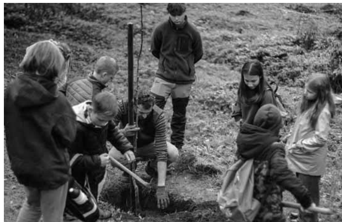
Sadenie stromčekov

130 žiakov a ich pedagógov zo Strednej odbornej školy lesníckej, Základnej školy Bakomi, Cirkev-