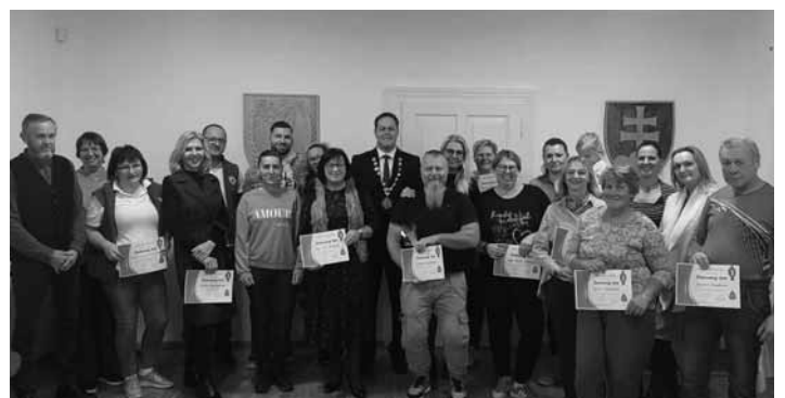
Ocenení darcovia krvi