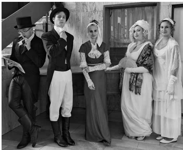
Študenti GAK na divadelnej súťaži