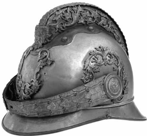
Hasičská prilba k slávnostnej uniforme

niku cechov ich povinnosť hasenia požiarov.