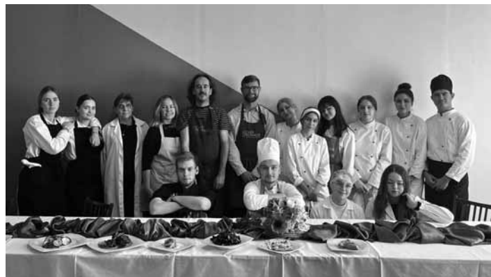
Účastníci kulinárskeho workshopu zo SHA