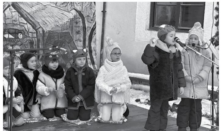
Vystúpenie detičiek z MŠ Čistinka

Uja Mikuláša sme pozvali aj do priestorov MŠ na predstavenie, ktoré pripravili pani učiteľky z Hudobno-dramatického krúžku a DFS Čistinka pod názvom Od Kataríny do Vianoc. V tanečno-divadelnom pásme nám šikovné detičky predstavili tradičné vianočné ľudové zvyky, ktoré kedysi dodržiavali naši predkovia a tí mladší nám zakedovali. Sme hrdí na to, že aj dnes môžeme našim deťom ukázať ako sa žilo a spoločne zachovávať hodnoty a odkazy minulosti.