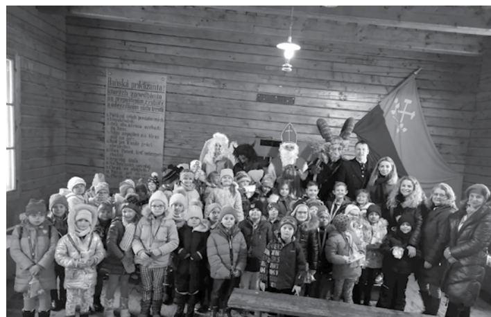
Prváci ZŠ v Banskom skanzene