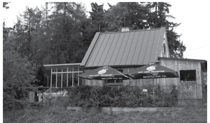
Kultúrno-turistické centrum na Červej studni

Začiatkom jari sme zateplili a zrekonštruovali strop v objekte Hájovne. Počas leta sme vybudovali multifunkčnú terasu pre návštevníkov a interpretov. V spolupráci s OOCR Banská Štiavnica sme spustili Live Stream prenos z lokality sedla Červená studňa, ktorý si viete pozrieť na webovom sídle www.hajovna.eu . Počas roka 2023 sme organizovali výstavy, koncerty, divadlá diskusie, prezentácie, letné kino. Našími stálymi akciami sú festival Drevo+ 4. ročník, detský a detinský festival Infantum 3. ročník v spolupráci s miestnymi mladými máme za sebou úspešný nultý ročník festivalu Realshit. Podujatia realizujeme s podporou FPU a BBSK. Tešíme sa, že naše priestory využili aj miestne školy,