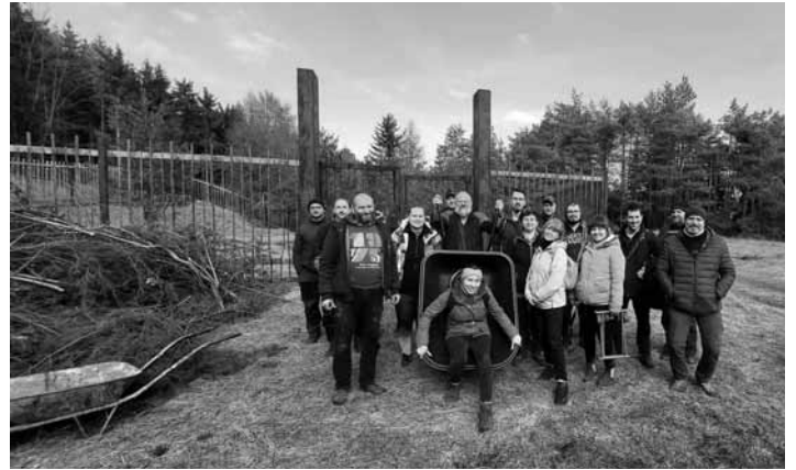
Účastníci brigády v areáli šachty Terézia

V roku 1970 – 1971 zabezpečilo SBM v spolupráci so závodom Rudné bane,