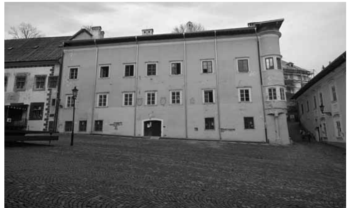
Budova Berggericht

Príprava projektovej dokumentácie bude trvať niekoľko mesiacov. Nebudeme nečinne čakať a pustíme sa do sanácie oporných múrov a príslušného svahu za dvorným, severovýchodným krídlom a bočným uličným juhovýchodným krídlom budovy Berggericht, ktoré sú v havarijnom stave. Súčasťou návrhu sanácie bude realizačný projekt sanácie s odvodnením svahu. Práce