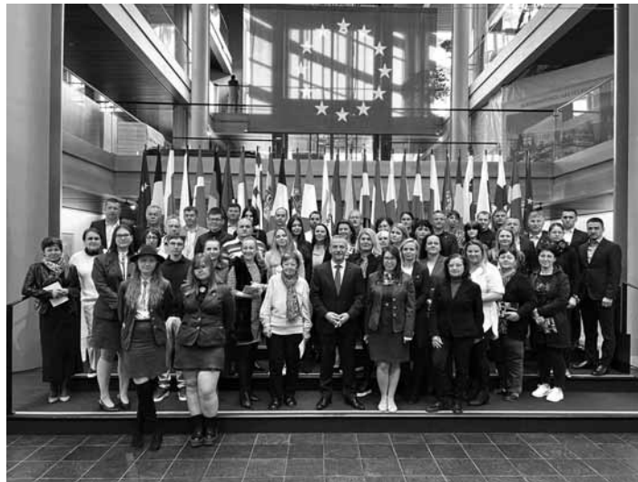
Delegácia v EP

Po niekoľkých upršaných dňoch v Štrasburgu s príchodom štiavnickej skupiny vyšlo slnko a popoludní bol tak ideálny čas objavovať zákutia pitoreskných uličiek mesta. Prehliadku mesta, návštevu katedrály Notre Dame a prechádzku malebnou štvrtou Petite France sme absolvovali so slovenskou sprievodkyňou, ktorá v meste dlhodobo žije. Štrasburg, ktorý mnohí nazývajú