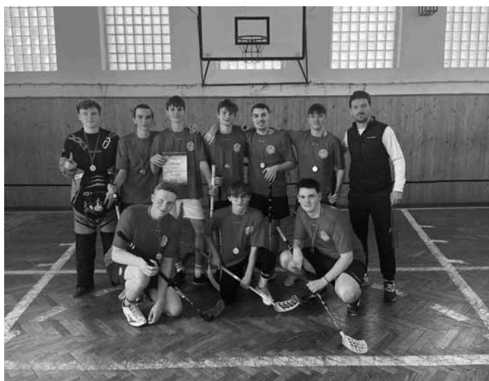
Florbalové družstvo zo SŠ SM v BŠ

Aj dievčatá vedia super hrať basketbal. Gratulujeme: 1. miesto: Katolícka spojená škola 2.miesto: ZŠ J. Kollára 3.miesto: ZŠ s MŠ B. Belá. Ďakujeme, p. rozhodca Dr. Petro.