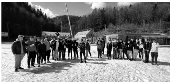
Pretekári v areáli lyž. strediska SKI Salamandra