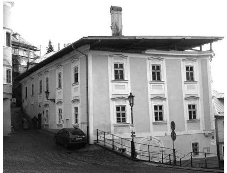
Szitnyayovský dom (budova ZUŠ-ky)

Pamiatkový výskum bol realizovaný oprávnenou osobou formou vizuálnej obhliadky a tiež formou sondážnou. Pamiatkový výskum odhalil aktuálne nálezové situácie, získané výsledky a nové informácie boli doplnené a porovnané s archívnymi podkladovými dokumentáciami, ktoré obsahovali staršie poznatky. Pamiatkový výskum nám okrem prehĺbenia odborných poznatkov priniesol aj otázku požiadavky na vypracovanie ďalších výskumov, posudkov a odborných dokumentácií.