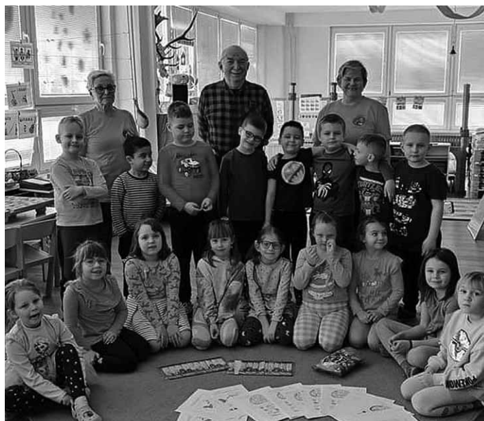
Deti z MŠ 1.mája s členmi JDS

Dozvedeli sme sa veľmi dôležité informácie, ako u detí stimulovať mozgové funkcie s ohľadom na ich vek a čo najpestrejším spek-