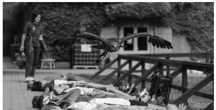
Prelet dravca ponad žiakov

V rámci projektu vzniklo KlímaEdu centrum, ktoré slúži ako vzdelávacie stredisko pre žiakov a návštevníkov školy. Okrem vytvorených edukačných materiálov, ktorých úlohou je oboznámiť návštevníkov s problematikou zmeny klímy, bolo vybudované nové jazierko, ktoré slúži ako technické opatrenie na zmiernenie dôsledkov zmeny klímy. Škola tiež vysadila medonosnú a protierozne rastliny s cieľom podporiť lokálnu biodiverzitu. Základná škola s materskou školou Maximiliána Hella