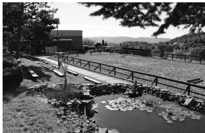
Revitalizácia školskej mokrade

Azda najdôležitejším aspektom pre vytvorenie a umožnenie environmentálne priaznivého správanie tých v útlom veku je osvetlenie učňami najdôležitejších – detí. Súčasťou plánu informačných a vzdelávacích aktivít bolo aj vytvorenie publikácie pre deti, ktorá poskytuje hravou, veku priradenou formou tie najdôležitejšie informácie potrebné pre priaznivý rozvoj a uvedomenie dôležitosti problému.