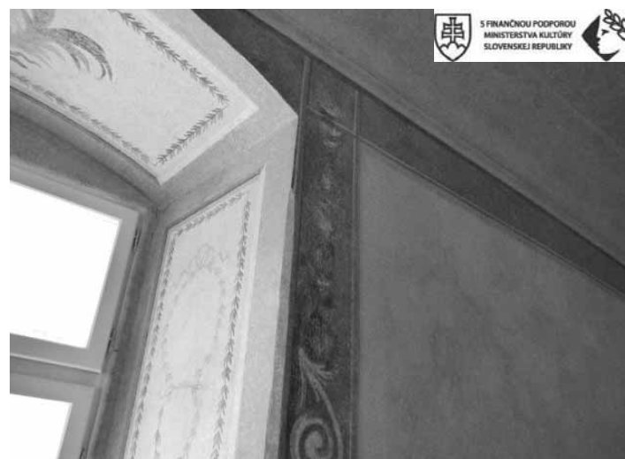
Zreštaurované maľby