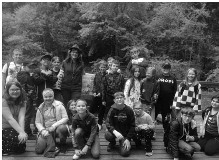
Žiaci ZŠ J. Kollára v Arboréte Kysihýbel