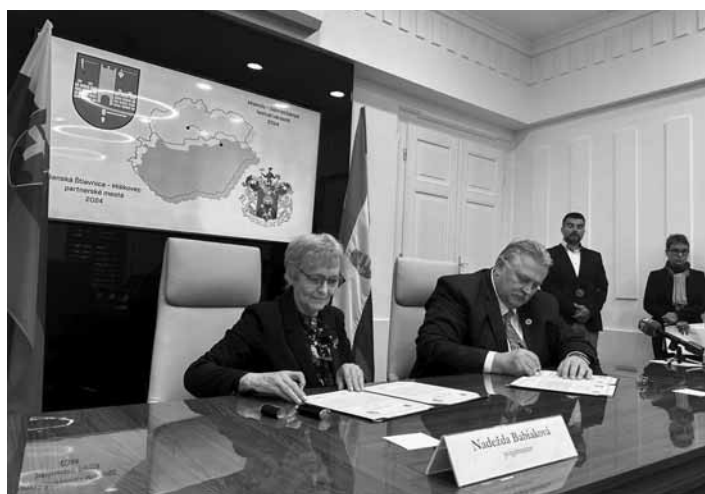
Podpísanie partnerskej zmluvy