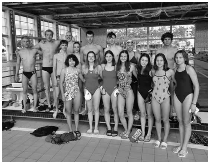
Reprezentačné družstvo diaľkoplavcov Slovenska

Od 21.5.2024 sedemnásť mladých diaľkoplavcov reprezentačného družstva Slovenska a útvaru talentovanej mládeže Slovenská plavecká federácia - SPF trénuje naplno na prípravnom sústredení v španielskom Lloret de Mar. Sústredenie je