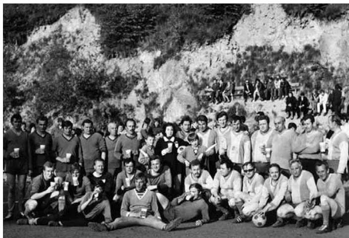
Futbalový výbor Slovan B. Štiavnica (1972)

Futbalový výbor Slovan B. Štiavnica – VB + Hasiči BŠ (pre mladšie generácie Verejná bezpečnosť je dnešná polícia). Zápas sa odohral za krásneho, slnečného počasia víťazstvom výboru FO 4:1. A radosť a veselie