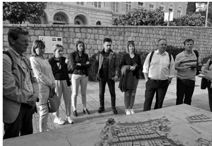
Účastníci konferencie v Dubrovniku

Témou konferencie bola bezpečnosť v mestách svetového dedičstva a manažment plán rizík, ktoré mestá ohrozujú vo forme prírodných alebo ľudmi zapríčinených katastrof, medzi ktoré sa radia požiare, záplavy, zemetrasenia alebo vojny. Jednotlivé mestá diskutovali o pripravenosti čeliť takýmto udalostiam a schopnostiam rýchleho zásahu, ako aj o preventívnych opatreniach proti uvedeným udalostiam. Zúčastnené mestá majú všetky skúsenosti aspoň s jednou z uvedených katastrof. Konferencie sa zúčastnil generálny tajomník