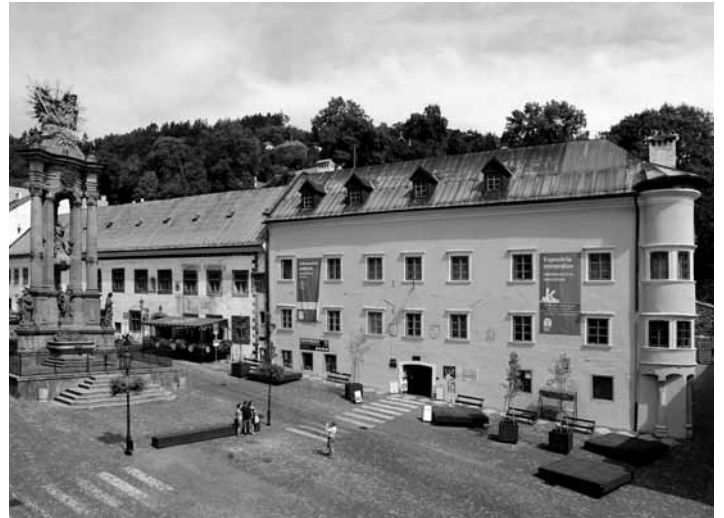
Hellenbachov dom (Berggericht)

Budova Berggerichtu stojí na východnej strane Námestia sv. Trojice. Pred históriou tejto pamiatky je však vhodné oboznámiť sa s počiatkami vývoja centra mesta. Aktuálne najstaršie datované stavby v B. Štiavnici (nerátame lokalitu Glanzenberg, ktorá sa taktiež nachádza v katastri mesta) nestáli pozdĺž námestia, ako by si nejaký čitateľ mohol myslieť, ale na ulici A. Kmeťa. Tu sa nachádzajú aj architekturné datované do 12. až 13. stor. Vďaka úpravám okolitého terénu vo vrcholnom stredoveku sa mestské budovy mohli stavať aj na okolitých svahoch, v tomto období započala aj výstavba na Nám. sv. Trojice. Tieto časti mesta, ktoré sú známe nádhernými meštianskymi budovami, dnes slúžiacimi často ako hotely a penzióny, mali z počiatku celkom iný výzor. Hlavne v počiatkoch baníctva a spracovania kovu v B. Štiavnici sa nachádzali objekty spájané s týmito činnosťami v dnešnom historickom centre. Námestie nebolo v tomto prípade výnimkou. Až postupom času sa objekty, kde sa spracovávala ruda začali presúvať do širšej periferie, dôvod bol možno praktický. Mestá boli v minulosti náchylné na vznik rozsiahlych požiarov, po prenesení hutníckej činnosti do okrajových oblastí