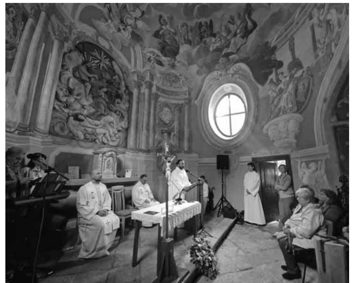
Slávnostná svätá omša na Kalvárii

Náš Stredný kostol prešiel hlavnou etapou obnovy v rokoch 2017-2018, následne sa začala obnova vnútorných malieb. Tá sa z dôvodov nových nálezov a nedostatku financií predĺžila z troch rokov na päť, nakoniec sa práce podarilo ukončiť. Niektoré časti kostola, hlavne malieb, boli v takom zlom alebo zmenenom stave, že niekoľko rokov trvalo, kým reštaurátori prišli na to, čo tam bolo pôvodne vyobrazené. Renováciu prešli aj samotné drevené schody, ktoré boli z vnútornej