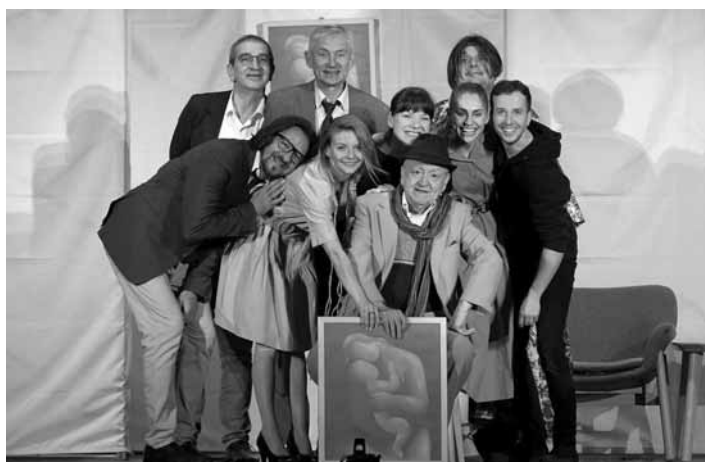
Radošinské naivné divadlo