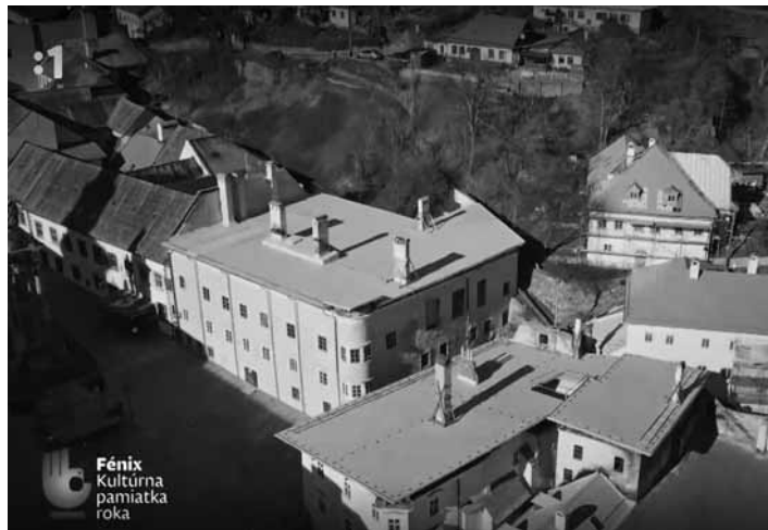
Pohľad na budovu Bergerichtu

podporujú a podieľajú sa na tomto významnom projekte. Spoločne tak prispievame k zachovaniu nášho kultúrneho dedičstva pre