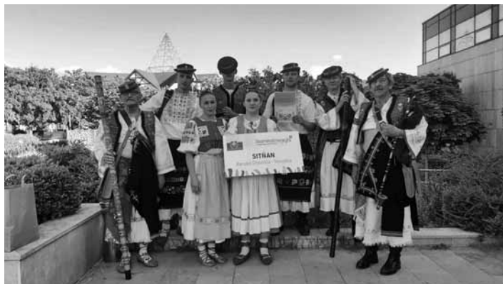
Jubilujúci FS Sitňan