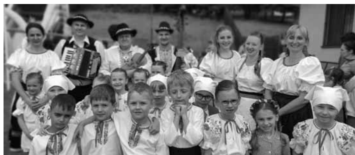
DFS Čistinka

Kedže náš súbor patrí medzi oficiálne súbory len jeden rok, o to väčšiu hrdosť pociťujeme. Pani učiteľka odaná folklóru telom aj dušou sa deťom trpezlivo venuje a s veľkou vervou s nimi nacvičuje tradičné ľudové pásmo. Na festivale deti predvedli ukážku práce žien na poli i detské hry