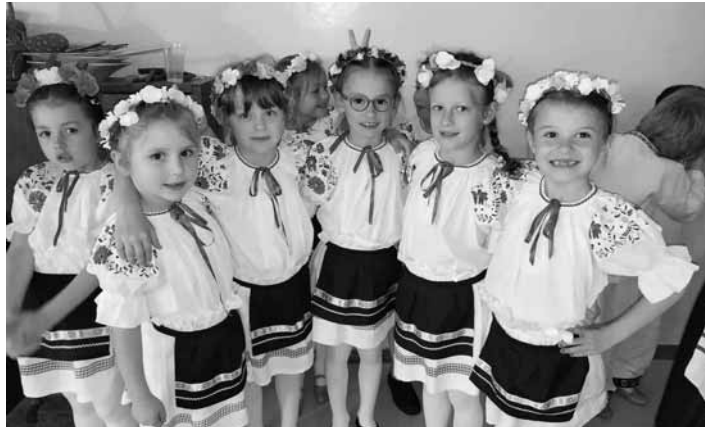
Detičky z MŠ Bratská 9

Deti z triedy Lienky sa predviedli s ukážkou „Vynášanie Moreny“ a symbolicky sa rozlúčili so zimou. Predškoláci z triedy – Mesiačky nám predstavili „Dožinky“ a na koniec vy-