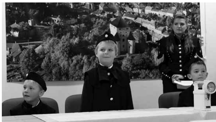
Permoníci z MŠ 1. mája

Malí Permoníci z materskej školy predviedli úžasné vystúpenie a preniesli nás do čias starých baníkov. Ich nadšenie a talent spravili z tohto podujatia nezabudnuteľný záži-