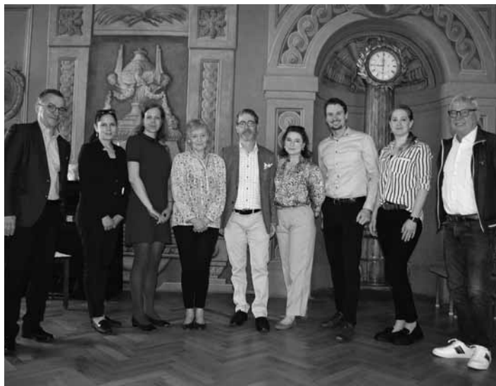
Prijatie delegácie na radnici primátorkou mesta