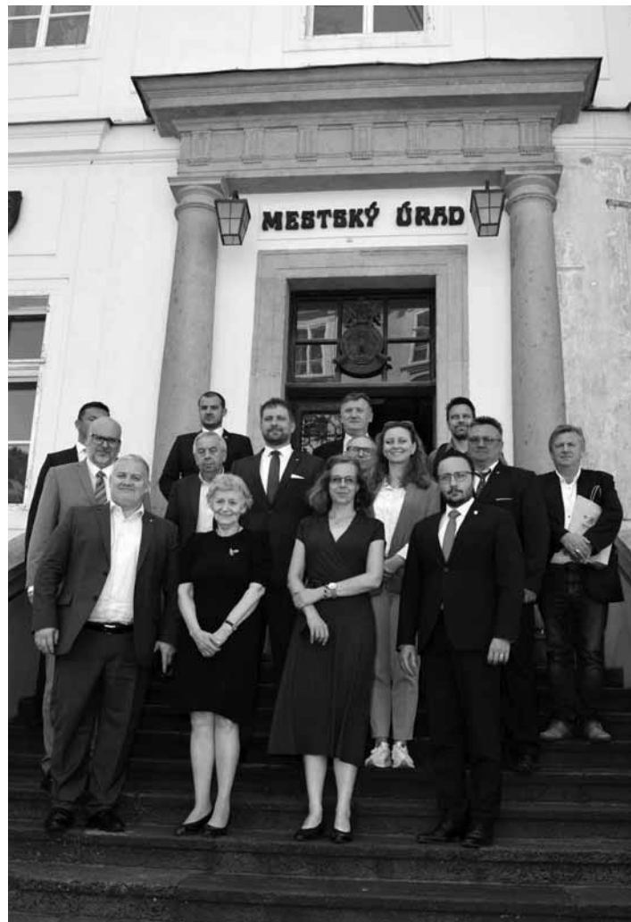
Účastníci stretnutia pred MsÚ