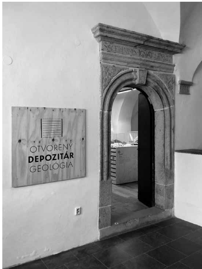
Vstup do nového výstavného depozitára

Nový otvorený výstavný depozitár bude prístupný verejnosti počas otváracích hodín expozície Baníctvo na Slovensku (Kammerhof, vstupné: dospelí – 2,00 €, zľavnené – 1,00 €). V rámci realizácie projektu SBM vydalo k otvorenému výstavnému depozitáru informačnú skladačku a pexeso, ktoré dokumentujú klenoty z bohatej mineralogickej zbierky SBM a tiež zničené a poškodené minerály počas ničivého požiaru budovy Berggericht, bývalej geologickej a mineralogickej expozície SBM.