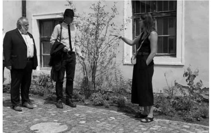
Riaditeľ SBM so štátnym tajomníkom MŽP SR