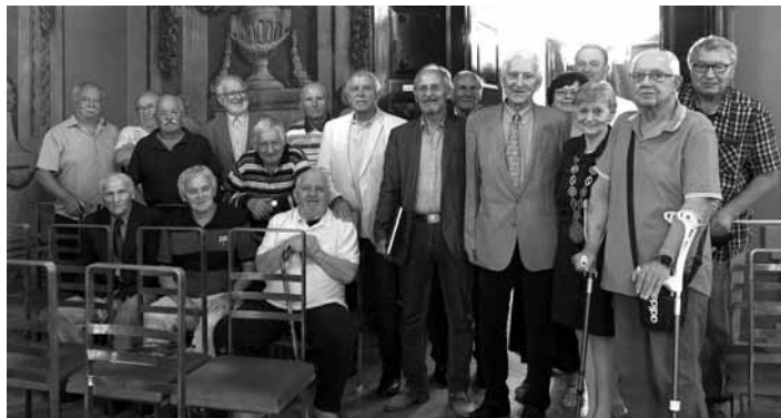
Stretnutie bývalých členov futbalového klubu

V roku 1920 začína nová éra futbalu v meste, vzniká prvý futbalový klub pod názvom „Atletický klub“, ktorý bol