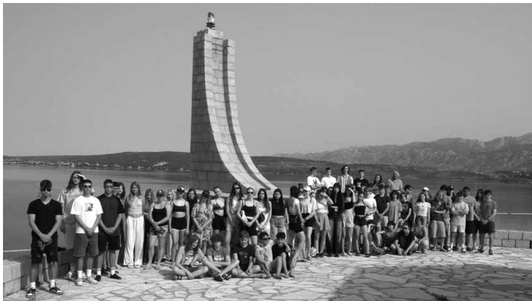
Kolektív študentov GAK v Novigrade