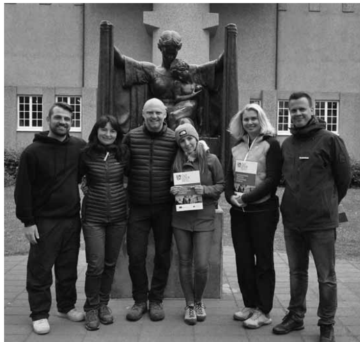
Učiteľky z MŠ 1. mája v Prahe na kurze hospitácií

Väčšinu kurzu sme však strávili v Jizerských horách, kde sme mali možnosť zažiť nezabudnuteľnú „Školu v prírode“ s predškôlkami. Tento pobyt bol jedinečný v tom, že deti sa okrem spoznávania oko-