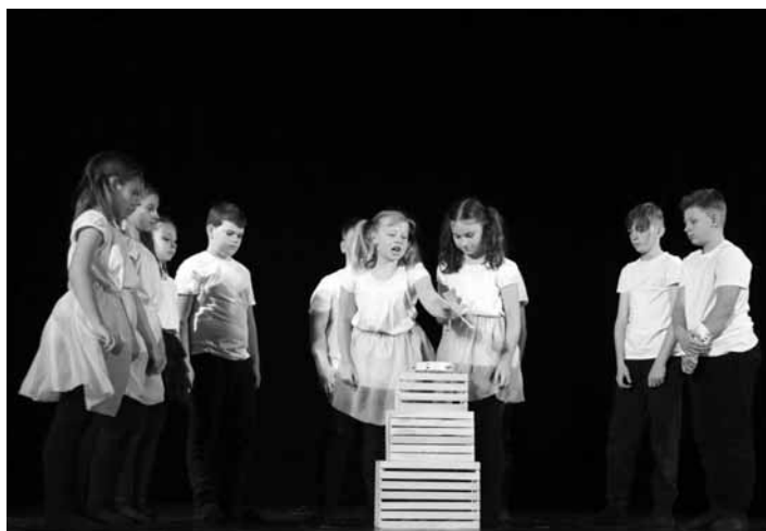
DDS Sovičatá zo ZŠ s MŠ MH ŠB

Tí, ktorí sa trochu venujú divadlu, vedia, že celoslovenské súťaže, na ktoré sa treba prebojovať cez regionálne a krajské kolo, sú v kategórii detí do 15 rokov dve – Hviezdoslavov Kubín a Zlatá priadka. A účasť na oboch celoslovenských súťažiach sa podarilo vybojovať práve detskému divadelnému súboru Sovičatá zo Štiavnických Baní. Postarali sa o to dve rôzne partie detí s dvomi úplne inými inscenáciami. Treba podotknúť, že zo všetkých detských divadelných súborov, ktoré pôsobia