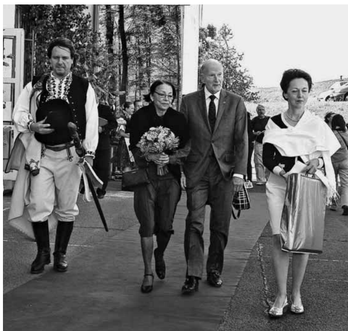
Jeho Veličenstvo Simeon Sachsen-Coburg Gotha

Ako hovorí bývalý cár Simeon II.: „Byť tu je pre mňa obrovským zážitkom. O Slovensku som veľmi veľa čítal a počul. Mój starý otec mal k tejto krajine a jej ľuďom po celý život hlboký a vrúcny vzťah.“ Netajil svoju radosť z toho, že znovu uvidí svätoantonický kaštieľ, ktorý je podľa jeho slov klenotom pre Slovensko, ale aj celý svet. O Slovensku veľa čítal: „Je to dôkaz duchovných väzieb, ktoré existujú medzi Slovenskom a Bulharskom,“