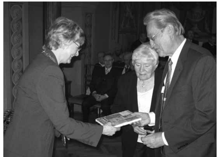
A. Hykisch s primátorkou v obradnej miestnosti

Anton Hykisch sa narodil 23. februára 1932 v Banskej Štiavnici. V 50. rokoch vyštudoval VŠE v Bratislave. Od roku 1962 bol jeho profesionálny život spojený s kultúrou a umením. Najskôr pracoval ako literárny redaktor v Československom rozhlas, následne v Ústrednej knižnici Slovenskej akadémie vied. Pracoval tiež ako ekonóm v Slovenskom fonde výtvarného umenia Dielo. V roku 1987 bol redaktorom, a neskôr sa stal riaditeľom vydavateľstva Mladé letá. V rokoch 1993 - 1997 pôsobil ako mimoriadny a splnomocnený veľvyslanec Slovenskej republiky v Kanade. Okrem týchto zamestnaní prednášal aj na vysokej škole. Ako spisovateľ patrí medzi predstaviteľov tzv. Generácie 1956. Jeho literárna tvorba zahŕňa rôzne žánre, od historických románov cez spoločenské romány až po eseje. Hykischove diela sú charakteristické precíznou analýzou historických udalostí a postáv, ako aj hĺbkovým pohľadom na spoločenské a politické problémy.