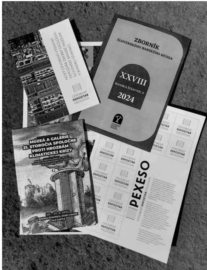
Nové tituly publikácií FOTO ARCHÍV SBM

lia zaujímavé témy, ako napríklad spracovanie „prípady“ nepoctivého skúšača rudy Mateja Kuglera