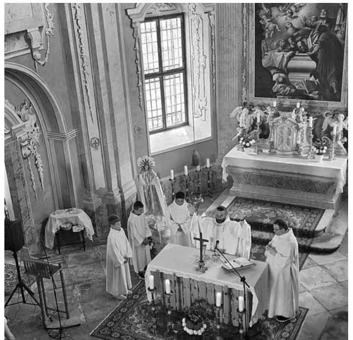
Svätá omša vo farskom kostole