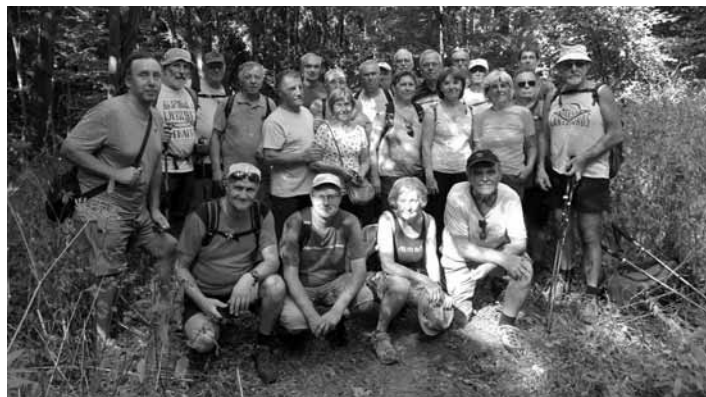
Účastníci turistiky

16. 8. 2024 Vychádzka po trase 1. značkovaného chodníka na území Slovenska k bývalej štólne Gedeon. 17. 8. 2024 Zasadnutie sekcie histórie turistiky KST v Banskej Štiavnici. Po zasadnutí bola pre účastníkov pripravená komentovaná prehliadka Banskej Štiavnice, kde sme účastníkov oboznámili s históriou