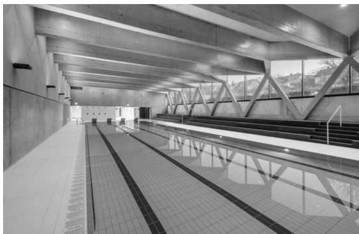
25 m bazén v SZŠ Guliver

Mesto v spolupráci so spoločnosťou Tidly Slovakia, a. s., uzatvorilo zmluvu o spolupráci, na základe ktorej je možné od 1.9. do 31.12.2024 využívať bazén v Súkromnej základnej škole Guliver.