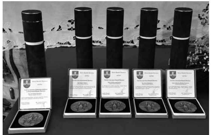
Výročné ceny mesta