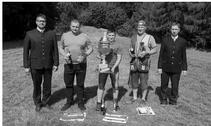
Ocenení v streleckej súťaži

Stredná odborná škola lesnícka Banská Štiavnica, SPZ, základná organizácia Diana Banská Štiavnica a Mestské lesy Banská Štiavnica, spol. s r.o. Streleckého preteku v kategórii