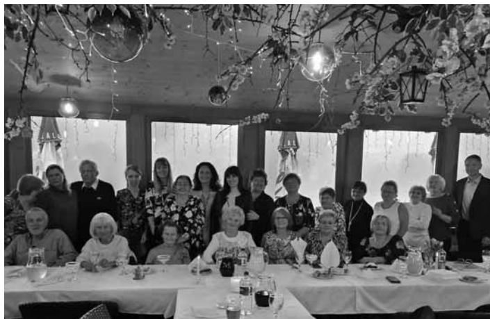
Lekári a zdravotní pracovníci v reštaurácii Windšachta