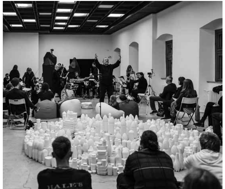
JAMA – 77. ročník Milana Adamčiaka

Nasledovať bude od 20.00 h jeden z vrcholov podujatia: koncert renomovaného komorného orches-