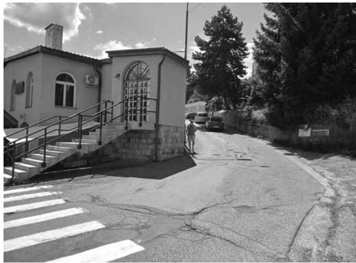
Ul. 1. mája pred rekonštrukciou

Úpravy verejných priestranstiev na ulici 1. mája v Banskej Štiavnici podľa vypracovanej projektovej dokumentácie riešia umiestnenie, úpravu existujúcich a vytvorenie nových parkovacích miest v rámci nevyhnutných úprav na komunikáciách. Vybúďuje sa nový chýbajúci chodník pre peších zo zámkovej dlažby po pravej strane od novinového stánku k hornej budove materskej školy.