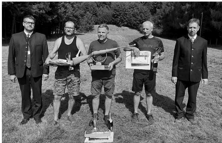
Úspešní strelci

Hlavným organizátorom podujatia boli Obvodná poľovnícka komora Žiar nad Hronom a Slovenský poľovnícky zväz, regionálna organizácia Stredné Pohronie. Podujatie ďalej podporili Mesto Banská Štiavnica,