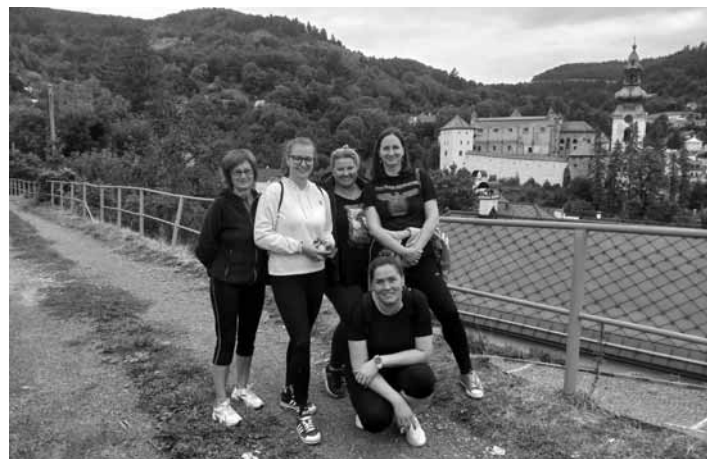
Dobrovoľníčky z MsÚ