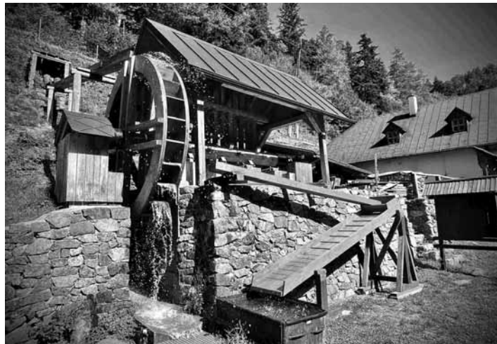
Zrekonštruovaná replika stupy v Hodruši-Hámroch