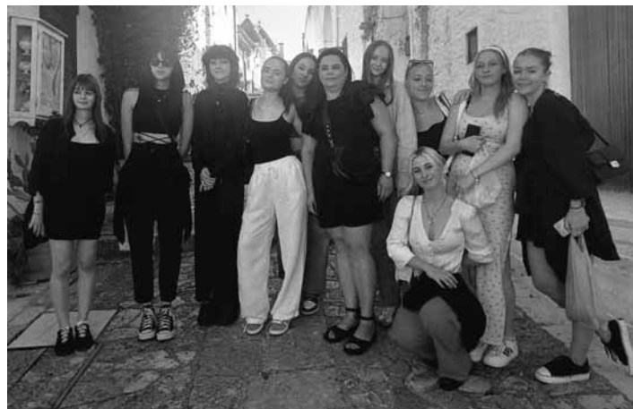
Študentky SHA v talianskom regióne

Súčasťou srdečného prijatia, vďaka partnerskej organizácii Cultura e Dintorni - Training and Mobility, bolo predstavenie samotného regiónu s jeho dominantami v podobe prenádherných miest, ako je Martina Franca, Alberobello, Lecce, Taranto, Monopoli či Polignano a Mare, vrátane gastronomických špecialít, ktoré dodávajú týmto oblastiam tú správnu chuť. Edukáciu v oblasti gastronómie, marketingu, geografie cestovného ruchu či dejepisu žiačky prepájali s odbornou stážou v rôznych prevádzkach, vďaka čomu spoznávali nielen typické produkty regiónu Apúlia, ale si aj s prehľadom trénovali svoje komunikačné zručnosti v anglickom, ba aj talianskom jazyku. Ich dočasným domovom sa stali pracoviská, ako Relais Villa San Martino, Park Hotel San Michele, Osteria del Coco Pazzo a Florian's Caffetteria. Svoju odbornú úroveň pozdvihli naše študentky pri príprave krémového rizota s morskými plodmi na hodine varenia so šéfkuchárom alebo prípravou známych cestovín