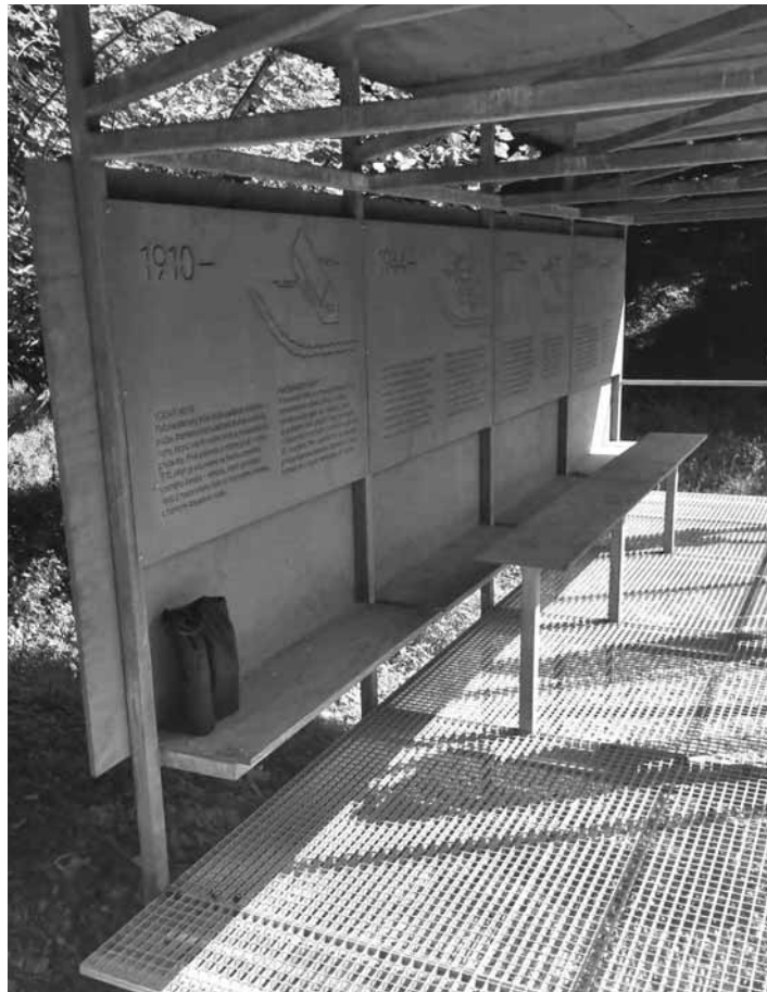
Informačná tabuľa k pamätníku

Kľúčovým bodom revitalizácie a prvou novinkou v roku 2024 je vyvýšená lávka. Táto etapa je financovaná z členského príspevku Rozvojovej agentúry BBSK v OOCR Región Banská Štiavnica. Lávka vedie po trase pôvodného vodného náhonu mlyna, sčasti symbolizujúca tok vody. Zostupuje od prístrešku až dolu do potoka. Prechádza ponad potok, do ktorého