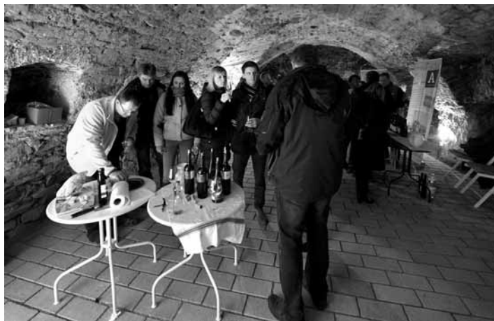
Degustácia regionálnych vín

Ku Špacírke neodmysliteľne patrí program „Cesta za vinárom“ a kvalitná gastronómia. Prvý deň podujatia, piatok 8.11. , sa vycestuje na návštevu vinárstva Frtus wine-