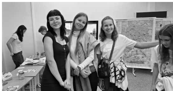
Študentky GAK

Vedeli ste, že v súčasnosti existuje viac ako 7 000 živých jazykov? Gymnázium Andreja Kmeťa v Banskej Štiavnici si pripomenulo aspoň tie európske v rámci Európskeho dňa jazykov 26. 9. 2024. Zároveň naša škola otvorila svoje brány žiakom základných škôl, ktorí si mohli prísť vyskúšať alebo obohatiť svoje jazykové znalosti. Okrem tradičných stánkov s angličtinou, španielčinou, ukrajinčinou, francúzštinou či ruštinou sme sa tento rok dočkali aj stánku s esperantom a interslavic. Posledne menovaný jazyk, nazývaný