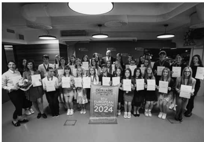
Slovak Cheer Team