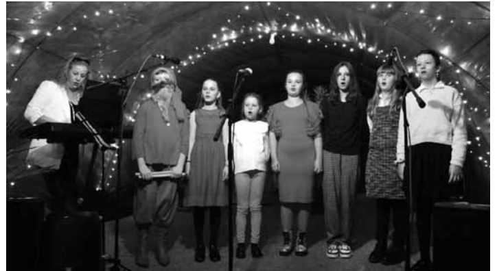
Z podujatia Salamander a baníctvo očami detí