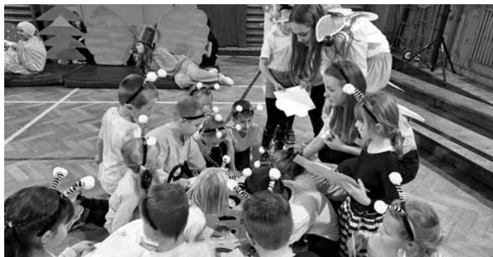
Prváci „včielky“ plnili zábavné úlohy