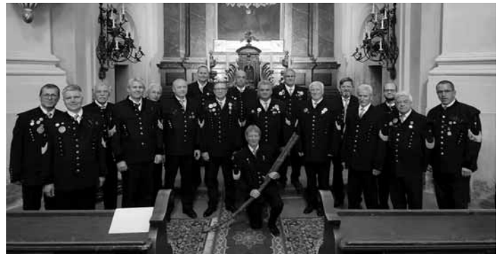
Spevokol Štiavničan v evanjelickom chráme

Má za sebou lepšie i horšie roky, kvalitné i menej úspešné vystúpenia. Občas nás dostihne únava, občasná choroba, a tak si kladíme otázku: Má zmysel pokračovať? Uvítali by sme, keby niekto z čitateľov odpovedal na položenú otázku. Nemusi to byť v novinách, môže nám poslať e-mail, SMS alebo odkaz na facebooku. Všetky naše kontakty sú na webe spevokolstiavnican.sk . Teraz a na tomto mieste chcem čitateľov oboznámiť, čím sme žili počas roka. Možno niektorých prekvapí, ale za uplynulý banický rok (10.9.2023 až 9.9.2024) sme absolvovali 52 skúšok a 56 rôznych vystúpení. Mohli nás počuť nielen v Banskej Štiavnici, ale aj v Žiari nad Hronom, Košiciach, Hodruši Hámroch, Veľkých Teriakovciach, Svätom Antone, Vyhniach, Hliníku nad Hronom, Gelnici a v rakúskom meste Bad Ischl. Aj po banickom dni plynulo pokračujeme v činnosti a naposledy sme mali koncert v Nitrianskom Pravne. Atmosféra bola výborná, akustika v miestnom kostole tiež a dokonca sme od vďačného diváka dostali aj drobný darček. Ďalšie významnejšie vystúpenie budeme mať 15.11. vo Zvolene na Festivale speváckych zborov a na domácej scéne v kultúrnom centre nás môžete vidieť ako hostia speváckeho zboru Hron dňa 16.11. Z už uvedených skutočností je zrejmé, že bez podpory našich rodín a našich priaznivcov sa nezaobídeme. Za túto podporu všetkým ďakujeme. Teší nás, že na prvom mieste medzi