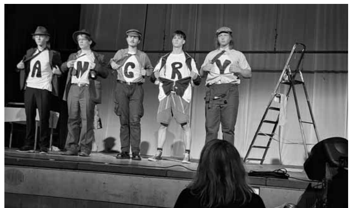
Herci z GAK