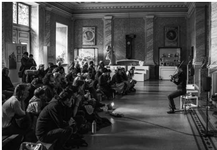
JAMA 78 - netradičný ranný koncert

Tento ročník sa konal pod názvom JAMA 78 v dňoch 11. a 12. októbra 2024 v B. Štiavni, B. Belej a okolí. Program bol skutočne bohatý a už prezentovaný. Ja sa preto zameriam na dvoch ľudí z celého tímu, ktorí boli dušou a hlavou celého podujatia a ktorí sa práve o celom tomto diele vyjadrovali s veľkou úctou a rešpektom. Keď som prišla na otvorenie v piatok do Parter BSC, vo veľmi príjemnej atmosfére som stretávala v druž-