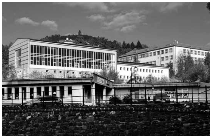
Objekt mestskej plavárne

Uvedomujeme si, že rozhodnutie o uzatvorení plavárne nebolo populárne, avšak sme presvedčení, že bolo racionálne. Podobným procesom prešli aj iné plavárne (napr. v Žiari nad Hronom) a dnes už opäť slúžia verejnosti zmodernizované, menej energeticky a finančne náročné.