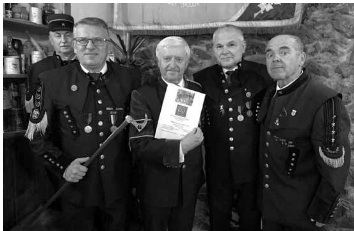
Jubilantov slávnostný šachtág