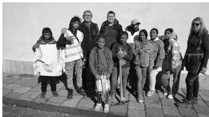
Žiaci II. st. ŠZŠ s pedagógmi

lesník, alebo slangovo povedané aj pán horár, žiakov najprv zoznámil s lesnou lokalitou výsadby, porozprával im o dôvode zalesňovania, resp. dolesňovania, ukázal a popísal im technologické postupy pri sadení lesných sadeníc a taktiež s nimi výsadbu realizoval. Mladé stromčeky jedľu bielu, smrek obyčajný, dub letný a buk lesný žiaci vysádzali v už lesnom poraste, ktorý je však potrebné z hľadiska ďalšej perspektívy dôvodne ošetriť a pripraviť na ďalšiu obnovu lesa. Výsadba prebiehala klasickými technikami, a to jamkovou sadbou a tiež štrbinovou sadbou. Počas dopoludnia žiaci špeciálnej školy vysadili viac ako 100 stromčekov, na čo boli právom všetci zúčastnení hrdí. Cestou späť do školy si ešte žiaci rozvíjali svoje vedomosti na edukačnej aktivite poznávania drevín, ktoré sa cestou od Klingera k Resle nachádzajú. Vydarená akti-