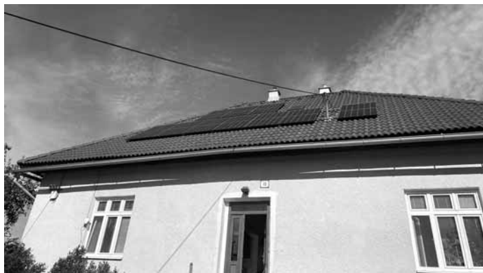
Nové fotovoltaické panely na útulku

Projekt bol realizovaný bez výrazných komplikácií a zahrnul nákup materiálu, inštaláciu panelov certifikovanými odborníkmi a následné monitorovanie efektivity systému. Klienti útulku boli zapojení do prí-