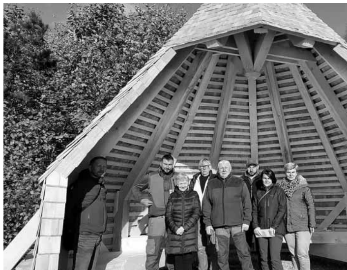
Nový prístrešok na Rosniarkach