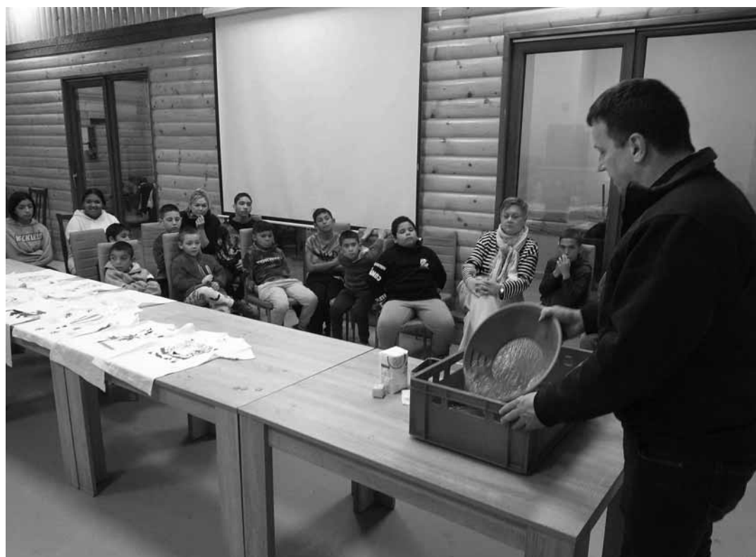
Edukačný workshopový deň plný príjemných zážitkov