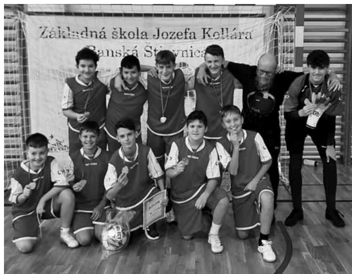
Víťazná škola J. Horáka

OK v stolnom tenise študentov SŠ, zúčastnených 5 SŠ, gratulujeme v kat. chlapcov: 1.miesto: Spojená škola Samuela Mikovíniho, 2.miesto: SOŠ lesnícka, 3.miesto: Katolícka spojená škola, kat. dievčat: 1.miesto: Gymnázium A. Kmeťa, 2.miesto: Spojená škola Samuela Mikovíniho, víťazi postupujú do krajského kola. Ďakujeme Katolícka spojená škola sv. Františka Assiského v B. Štiavnici za prípravu