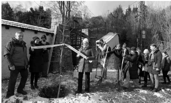
Vysadenie orecha kráľovského