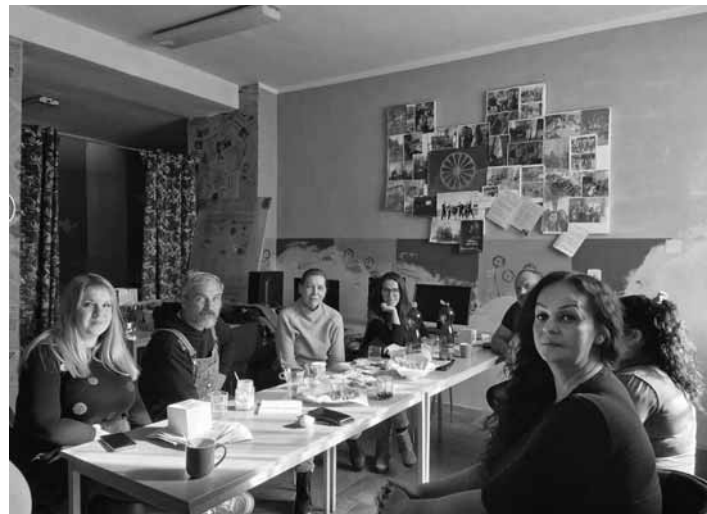
Stretnutie pracovníkov KC FOTO ARCHÍV KC ŠOBOV BŠ