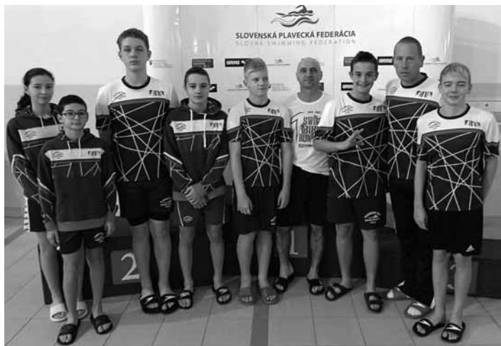
Štiavnickí plavci v Dolnom Kubíne

Jakub B. 200m VS 2:12,88, 200m P 2:46,21, 400m PP 5:15,52