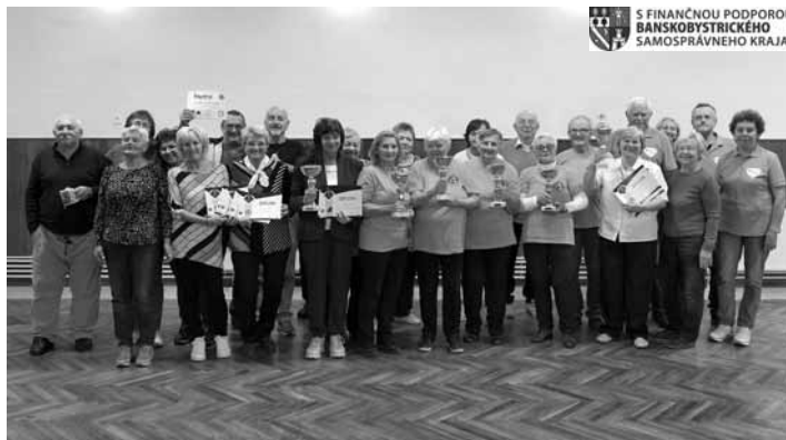
Ocenení aktívni športovci - seniori

Druhá polovica dňa sa niesla v znamení odovzdávania cien úspešným špor-