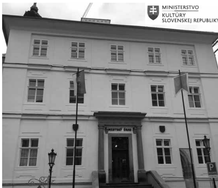
Budova historickej radnice

Celkové finančné prostriedky na rekonštrukciu predstavujú sumu (1 124 818 € - zazmluvnená, vy-súťažaná cena) 1 311 000 € - (cena z projektantského rozpočtu), z toho 800 000 € poskytlo Ministerstvo kultúry SR v rámci tohto projektu, 135 000 € poskytlo MF SR a 227 311 € je spolufinancovanie mesta. V rámci predchádzajúcich rekonštrukcií bola zrekonštruovaná Kaplnka sv. Anny, a teraz sa pokračuje s ďalšími rekonštrukciami.