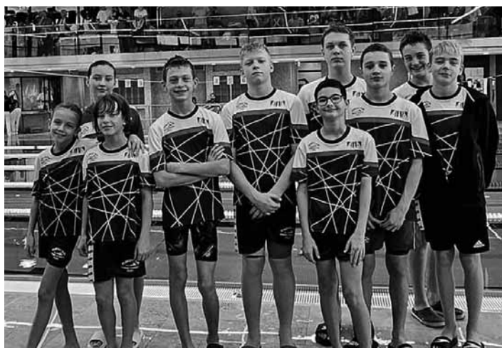
Najlepší plavci z PK BŠ

Hanka a Jiří po 1x Všetkým k ich úsiliu a snahe gratulujeme, a dúfame, že im to vydrží aj bu-