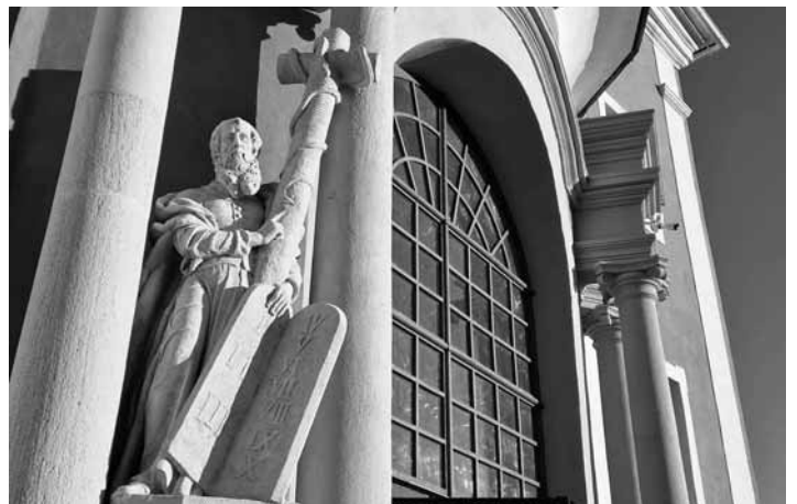
Horný kostol na Kalvárii

Na Kalváriu prišlo za 3 dni takmer 3000 návštevníkov. Ľudia využili nádherné počasie, ako keby nebol už november. Tešili sa z nádherných výhľadov a obdivovali fasádu Horného kostola, kde sú už osadené obidve veľké sochy Mojžiša a Abraháma. Ale žiaľ, na konci víkendú všetko prekrylo zistenie, že sme tu opäť mali zlodeja. Z vyhliadkovej veže zmizla pokladnička. Je to o to šokujúcejšie, že to musel byť niekto z návštevníkov, ktorý si požičal a potom vrátil kľúč, keďže pokladnička je za dverami a tie zostali nepoškodené. Vežu sme pre verejnú prístupnosť v máji 2023 a tento projekt sa teší veľkej obľube. Pokladnička v samotnej veži je pre návštevníkov, ktorí sa rozhodnú ísť na prehliadku až na samom vrchu Kalvárie,