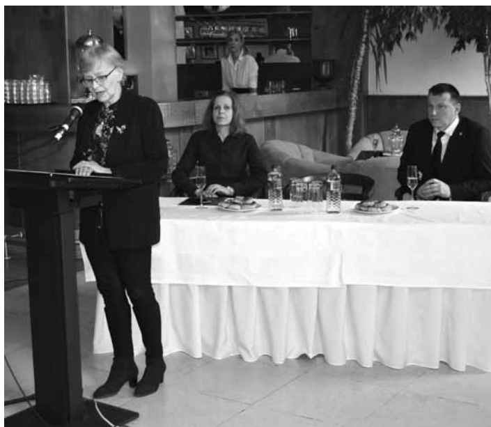
Príhovor primátorky mesta