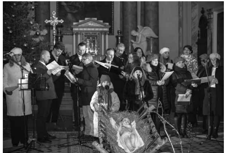
Spevácky zbor vo farskom kostole v BŠ