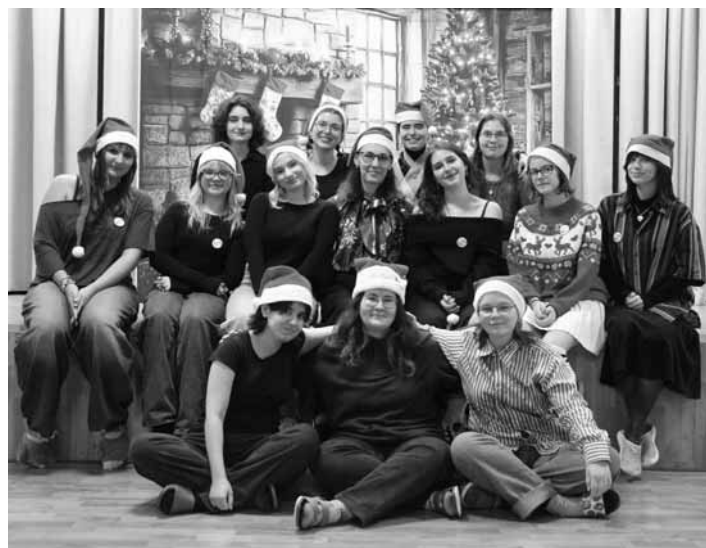
Internátni dobrovoľníci pri SOŠ SaL v BŠ