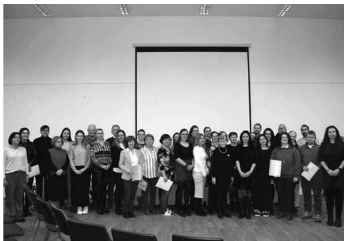
Ocenení dobrovoľníci mesta

Dobrovoľníci a ich aktivity boli rozdelené do troch kategórií. Prvou bola skupina dobrovoľníkov z radov zamestnancov MsÚ, ktorí sa okrem iných aktivít zapojili aj do projektu „Kolkó lásky sa zmestí do krabice od topánok“. Druhou skupinou boli dobrovoľníci a organizácie, ktorí pomáhali pri organizácii Cestného behu Trate mládeže