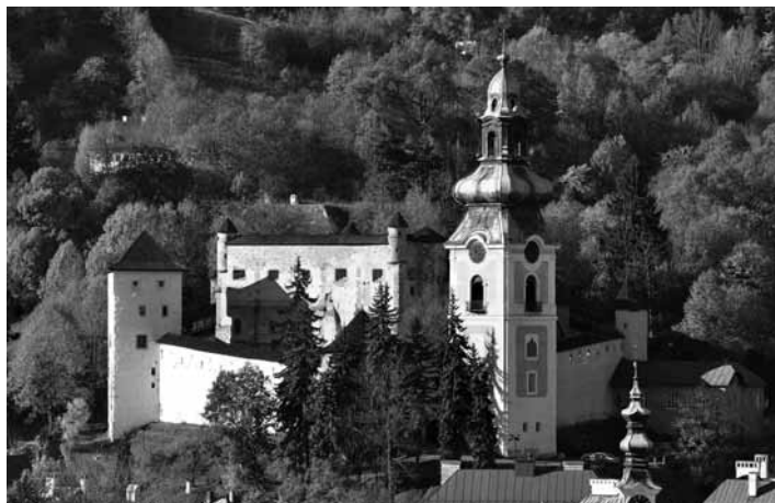
Pohľad na Starý zámok - mestské múzeum

„Oslava 125 rokov múzejníctva v Banskej Štiavnici je pre nás záväzkom po-