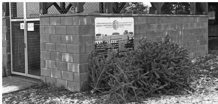
Vianočné stromčeky pri stojiskách