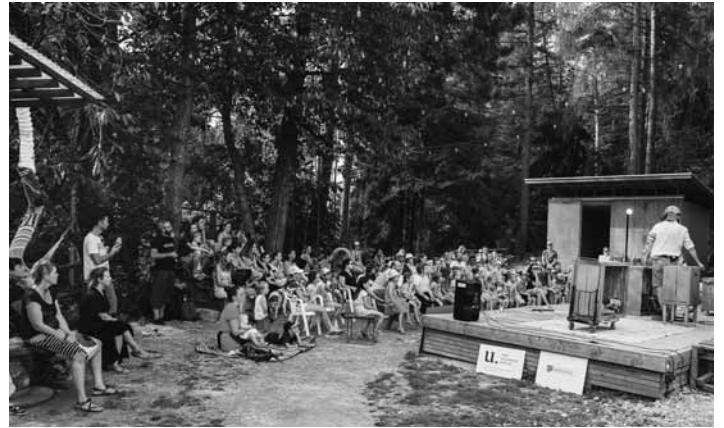
Divadelný festival infantUM

V zimnej sezóne v spolupráci so SVP, š.p., a s pomocou DHZM Ban-