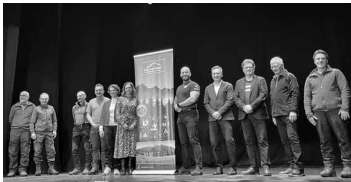
Účastníci stretnutia turistov v KC