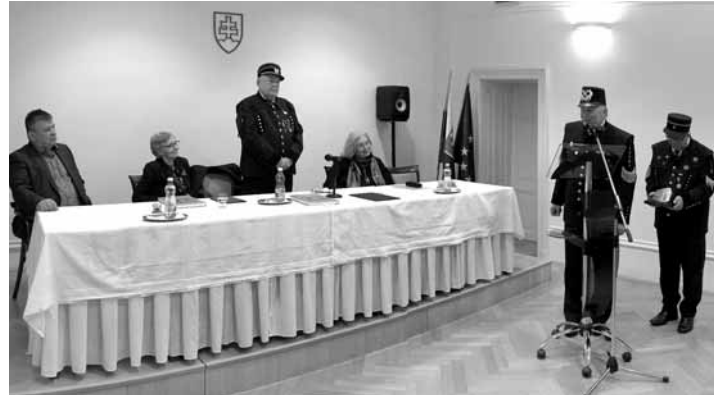
Odvzdanie symbolického daru

Aj keď o živote Majstra M.S. sa zachovalo málo písomných prameňov, autor sa v knihe pokúsil rozlúsknuť jeho identitu na základe analýzy štýlu, techniky jeho výtvarných diel, porovnaním jeho tvorby s dielami významných súdobých sochárov, maliarov a grafikov z oblasti Saska, Poľska, Sliezska a taktiež štúdiom ďalších historických prameňov. V ďalších kapitolách kniha prináša nové tézy a poznatky o výstavbe a výtvarnej výzdobe Kostola sv. Kataríny, ako aj o málo známych sochách - Madony s Ježiškom z Hodruše a Ilije z 15. storočia. Autor sa tiež zaoberá význa-