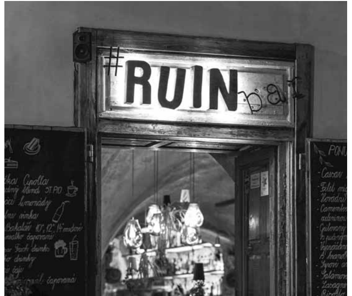
Jedinečný #RUINbar na Slovensku

Naším cieľom je, aby to bol príjemný priestor v prvom rade pre nás, Štiavničianov a taktiež, samozrejme, pre návštevníkov mesta. Počas celého roka robíme veľa ústretových krokov v gastronómii, kde podporujeme v prvom rade miestnych podnikateľov, lokálnych dodávateľov, či je to chlieb zo Štiavnickej pekárne, kvety zo Záhradného centra, prípadne drevo zo Štiavnickej píly a mnoho ďalšieho. Snažíme sa robiť všetko pre to, aby sme čo najviac podporili Štiavničianov a šikovných ľudí v regióne. Pred 2 rokmi sme sa vydali novou cestou, kde v roku 2024 sme urobili 132 podujatí, ktoré boli zdarma. Podujatia boli rôzneho druhu. Či už išlo o koncerty populárnej hudby, ale aj vystúpenia žiakov ZUŠ, dávame taktiež priestor miestnym umel-