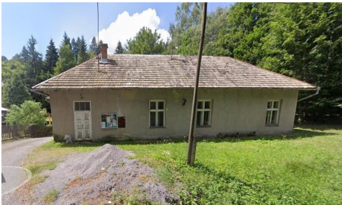
Pozemok parc. č. E KN 3140 (CKN 158)