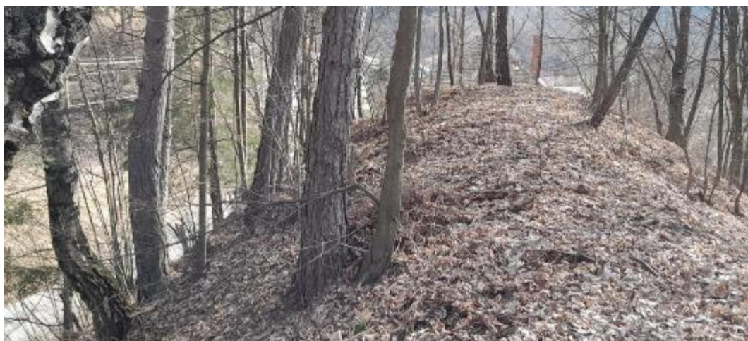
Pozemok parc. č EKN 3140 (CKN 130)